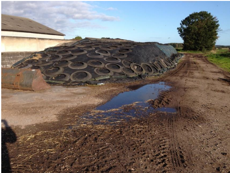
Ensilage ud over rand af ensilageplads.