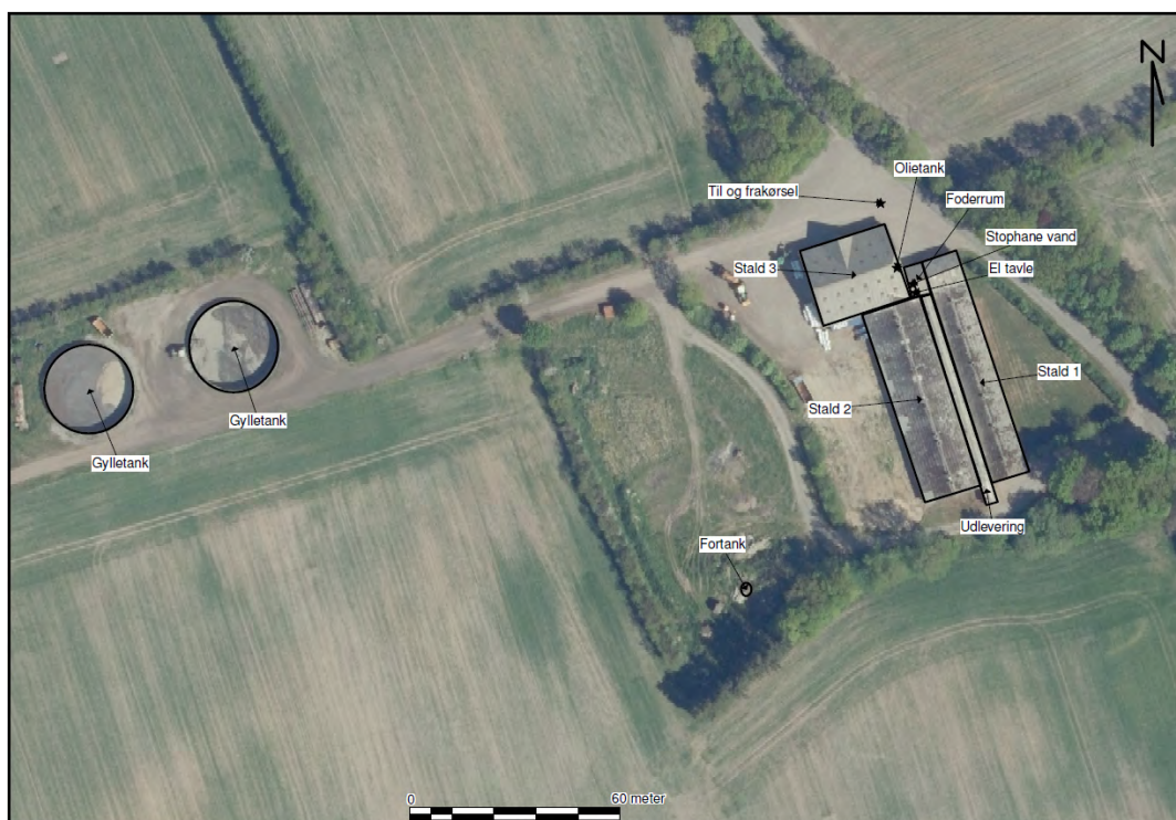
Figur 1. Oversigt over stalde og gødningsopbevaringsanlæg.

Det godkendte staldanlæg kan med denne miljøgodkendelse udnyttes fuldt ud inden for grænserne for dyrevelfærdsreglerne. Se en oversigt over stalde i figur 1.