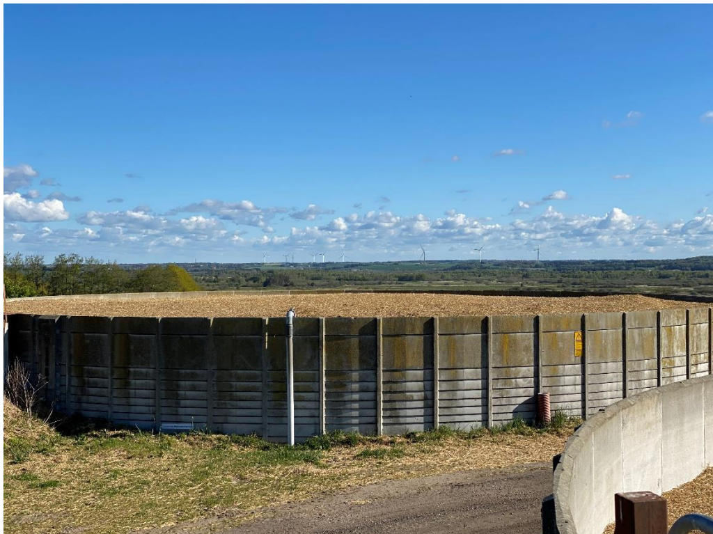
Figur 1 Begge beholdere var på tilsynstidspunktet forsynes med et tæt og dækkende lag halm >10 cm