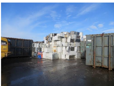
Oplag af køleskabe. Køleskabe står ikke i lodret stilling i mindst 12 timer inden kompressoren udtages.