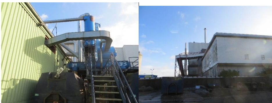
Afsug fra shredder til Fjernvarme Fyn og opsamling af isoleringsmateriale i containere. Videre rørføring til Fjernvarme Fyn.