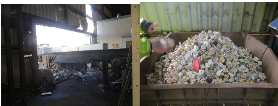
Spild omkring transportbåndet til køleskabshredder. HJ Hansen oplyste, at der ryddes op hver dag ved fyraften. Afklip af stik fra køleskabe.