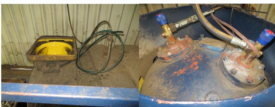
Opsamling af kompressorolie i olietank Opsamling af CFC gasser fra kompressoren i tank.