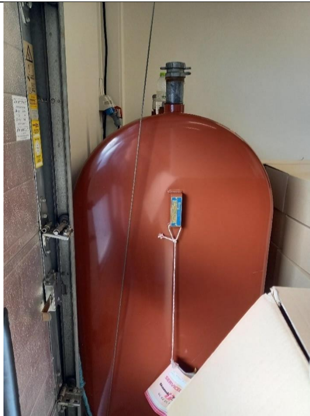
Billede 2: indendørs olietank på Lerbakken 2