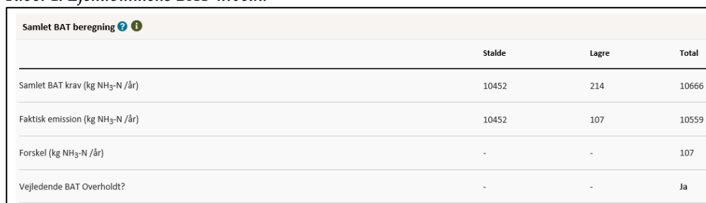
Tabel 1: Ejendommens BAT-niveau

BAT kravet i forhold til Miljøstyrelsens vejledende emissionsgrænseværdier opnåelige ved anvendelse af bedste tilgængelige teknik (BAT) er dermed umiddelbart overholdt. Kommunen vurderer dermed, at der ikke er behov for at stille vilkår om yderligere BAT- tiltag vedr. staldindretning frem til næste revurdering.