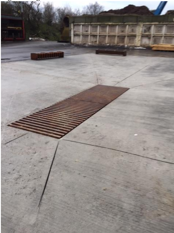
Figur 3 Vaskeplads

Vaskepladsen er færdig renoveret med ny beton belægninger og afløbssystem til det interne renselanlæg. På tilsynet manglede fugerne at af blive færdiggjort. Pladsen var således ikke taget i brug endnu.