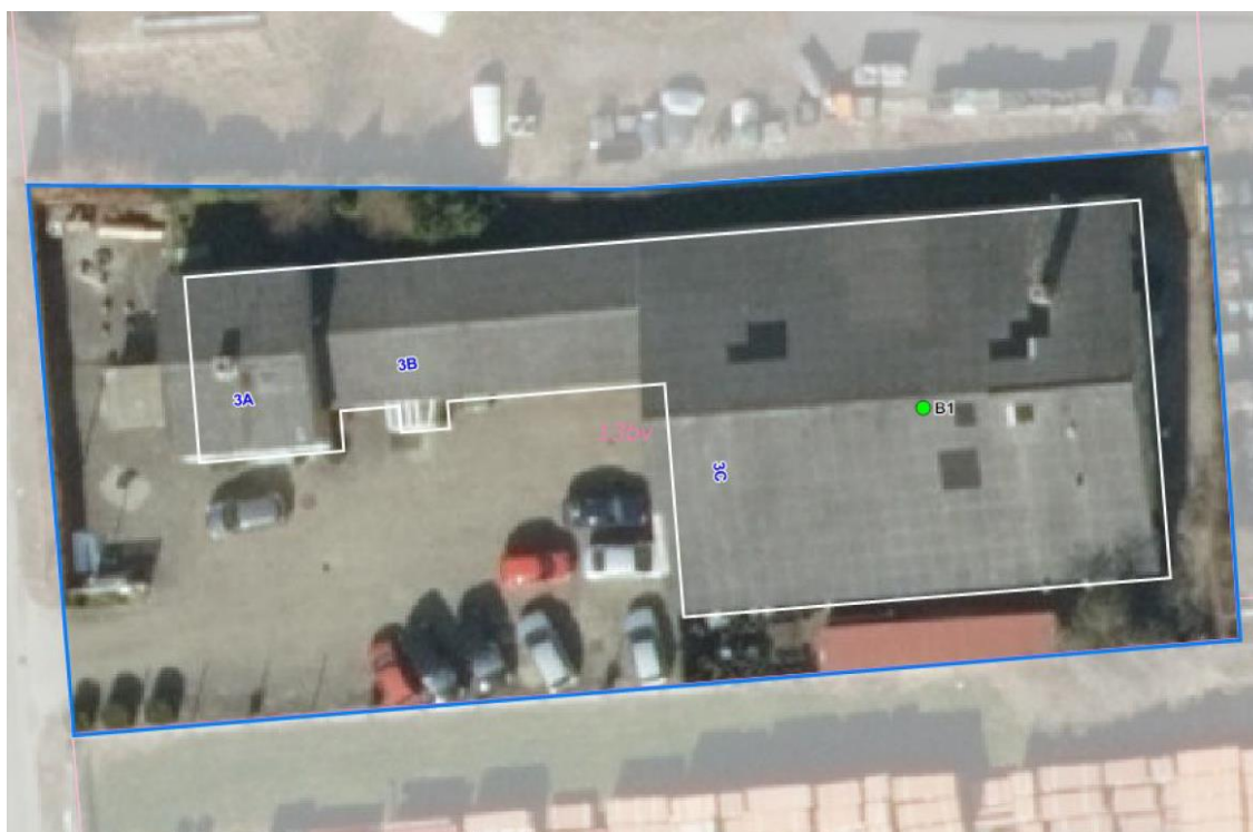
Luftfoto med virksomhedens beliggenhed og matrikelskel

I forhold til kommuneplanen ligger virksomheden i område 160513ER der er udlagt til erhverv. Området er omfattet af lokalplan 116. Ejendommen omfatter som det fremgår af nedenstående luftfoto tre særskilte bygninger (3A, 3B og 3C), hvoraf virksomheden er indrettet i 3C.