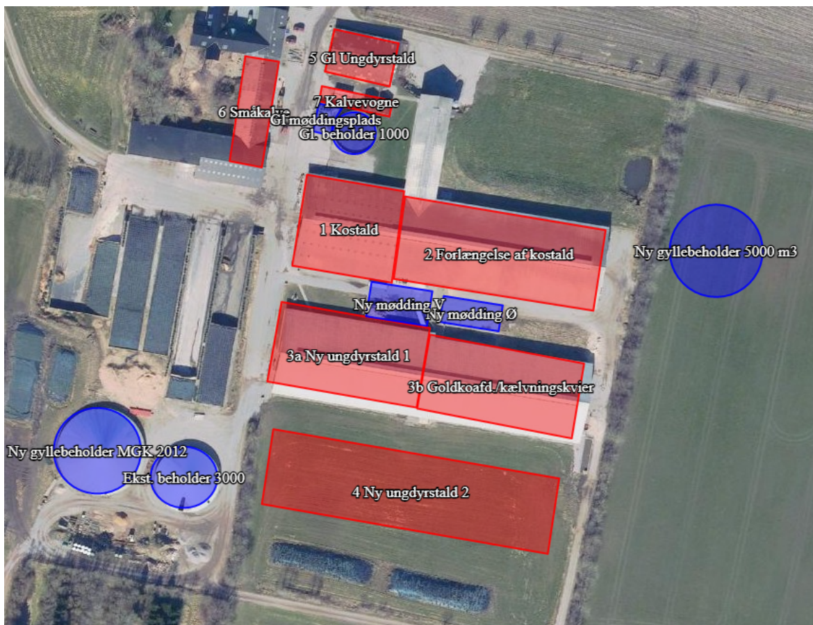
Figur 1: Stalde og gyllebeholderes placering i tillægget fra 2018.

Da du har et tillæg til en eksisterende miljøgodkendelse fra 8. februar 2018, som endnu ikke er fuldt udnyttet (stalden til ungdyr, angivet som bygning 4 på figur 1 nedenfor og gyllebeholderen på 5000 m 3 er endnu ikke opført), har jeg været inde og vurdere om det anmeldte vil kunne indeholdes i det allerede miljøgodkendte.