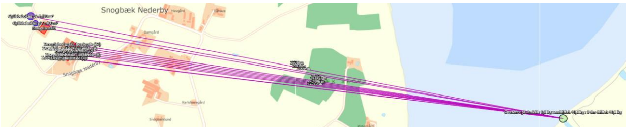
Figur 3: Afstand fra ejendom til Kategori 2 naturområde ved Arnkilsøre

Det nærmeste kategori 2-område er et beskyttet overdrev ved Arnkilsøre, beliggende ca. 2.5 km vest for anlægget (se figur 3). Der er i IT-ansøgningssystemet beregnet en totaldeposition på 0,0 kg N/ha pr. år. Beskyttelsesniveauet er dermed overholdt.