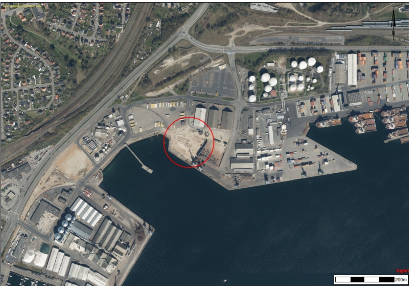
Kortbilag i målestok