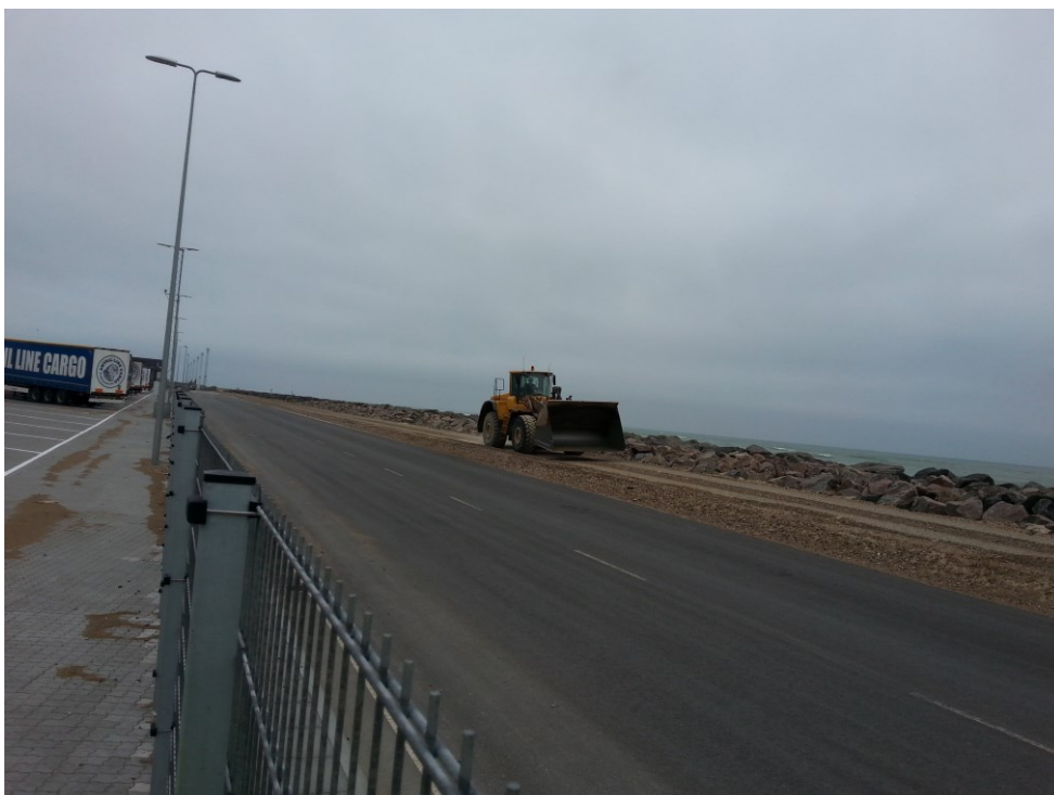
Hirtshals Havn. Gamle nedlukkede deponi. Ydre dæmning med kørevej.