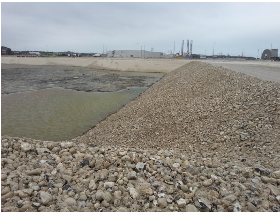
Hirtshals Havn. Nyt deponi etableret i april 2017. Indre dæmninger med beskyttende stenlag.