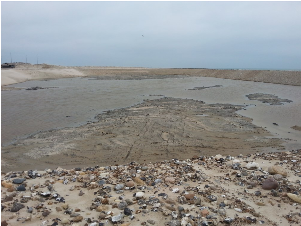
Hirtshals Havn. Nyt deponi godkendt 31. marts 2016. etableret i april 2017. Fotograferet fra deponiets østlige ende.

Miljøstyrelsen finder at der kan gives ibrugtagningstilladelse jf. bestemmelserne i Deponeringsbekendtgørelsen efter fremsendelse af fyldestgørende kontroldata for anlægsarbejdet.