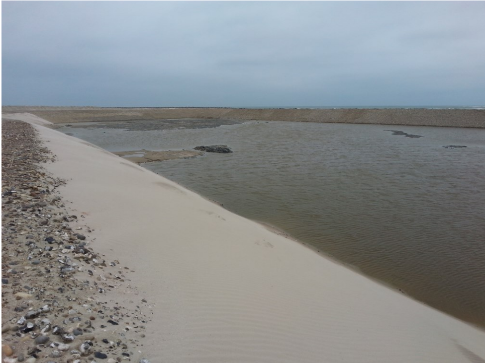
Hirtshals Havn. Nyt deponi etableret i april 2017. Sydvestlig dæmningskråning er dækket af fint sand pga. sandfygning.