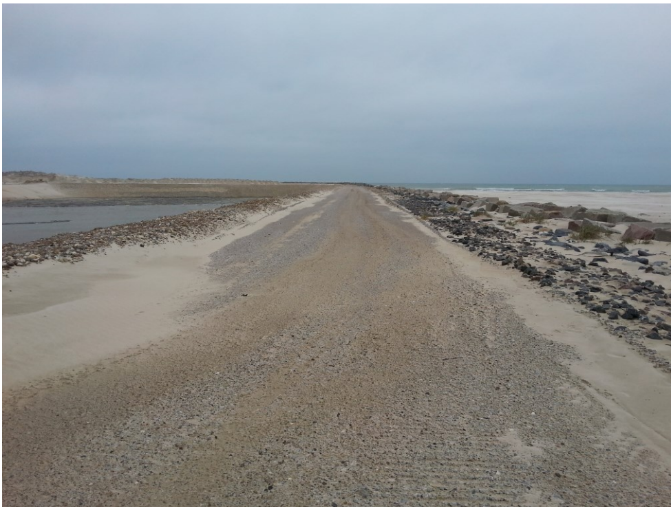
Hirtshals Havn. Nyt deponi etableret i april 2017. Ydre dæmning adskiller deponiet fra havet.