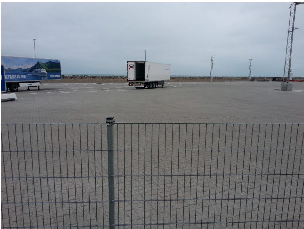
Hirtshals Havn. Det gamle deponi (enhed 1) bag østmølen på Hirtshals Havn. Det nu nedlukkede deponi er slutfærdiggjort og arealet belagt med sf-sten. Arealet benyttes til parkering/oplag ifm. færgeareal.