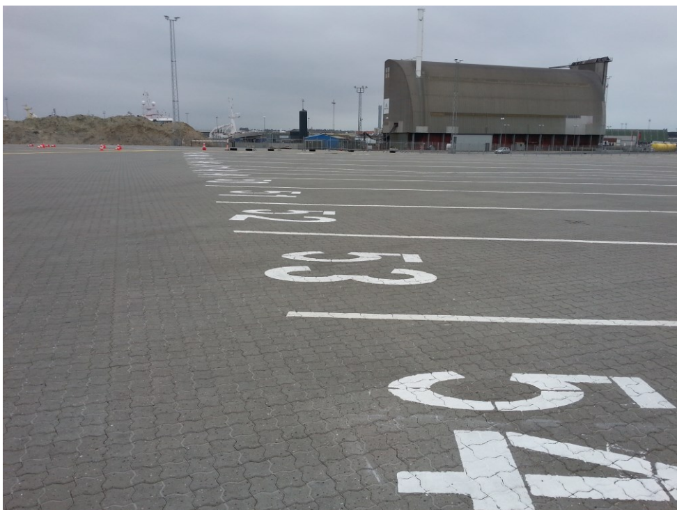
Hirtshals Havn. Gamle nedlukkede deponi. Deponering er ophørt. Benyttes i dag til opmarchområde for Hirtshalsfærgerne.