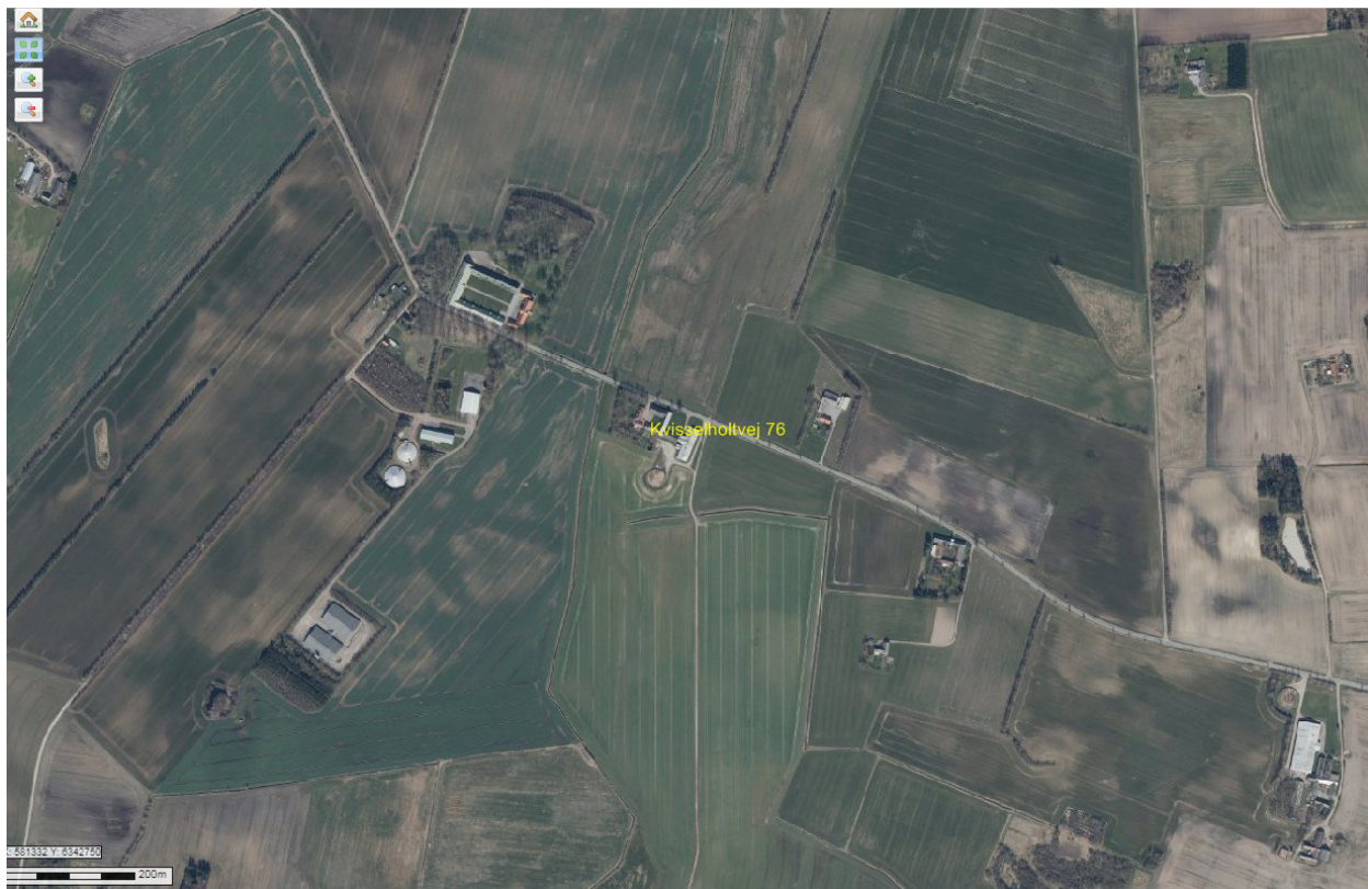
Figur 2. Landskabet omkring Kvisselholtvej 76 set fra oven, forår 2019.

Alle bygninger ligger desuden uden for naturbeskyttelseslovens bygge- og beskyttelseslinjer, og der er ingen særlige friluftsjnteresser knyttet til området med landbrugsejendommens bygningsmasse.