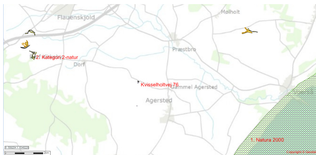
Figur 5. Naturområder omfattet af kategori 1- og 2-natur.

Beregningerne af højeste merdeposition og højeste totaldeposition til naturområderne fremgår af tabel 8. Placeringen af naturpunkterne kan ses af kortene herunder.