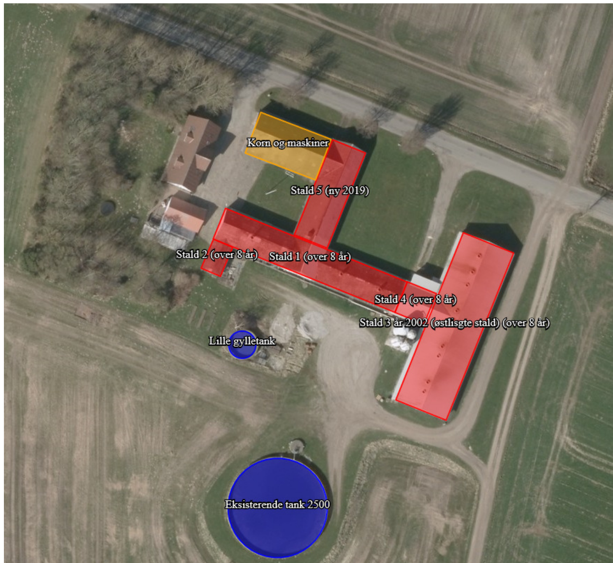
Figur 1. Oversigt over anlægget.

Den ansøgte ændring medfører ikke, at der bliver bygget nyt på Kvisselholtsvej 76. Der er dog søgt om at indrette smågrisestald i laden (stald 5).