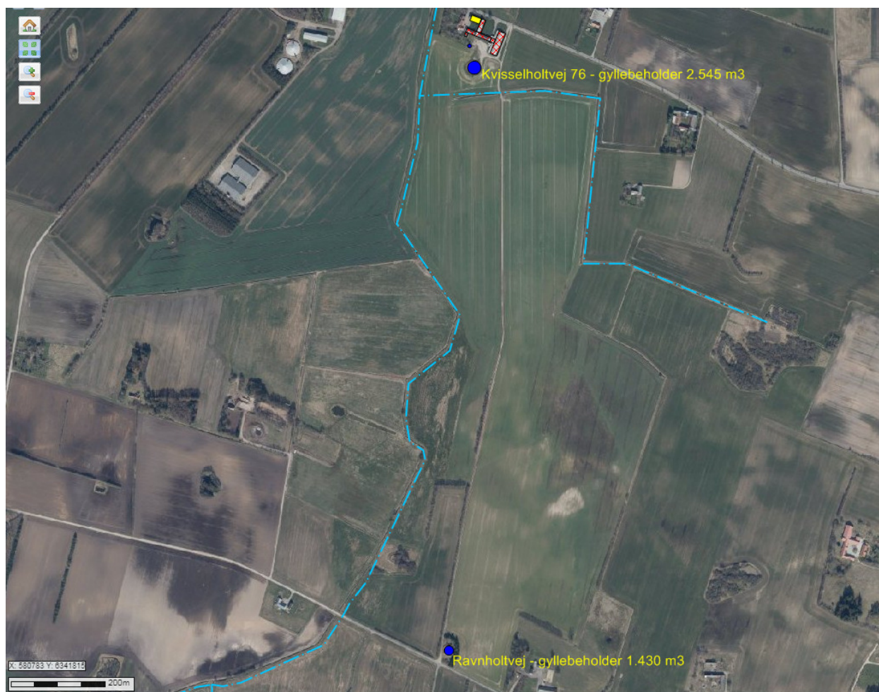
Figur 4. Oversigt over gyllebeholdernes beliggenhed i forhold til beskyttede vandløb.

Beholderen på Kvisselholtvej 76 ligger mindre end 100 m fra vandløb (vandløb syd for ejendommen beskyttet efter naturbeskyttelsesloven) og skal derfor kontrolleres hvert 5. år og være forsynet med gyllealarm.