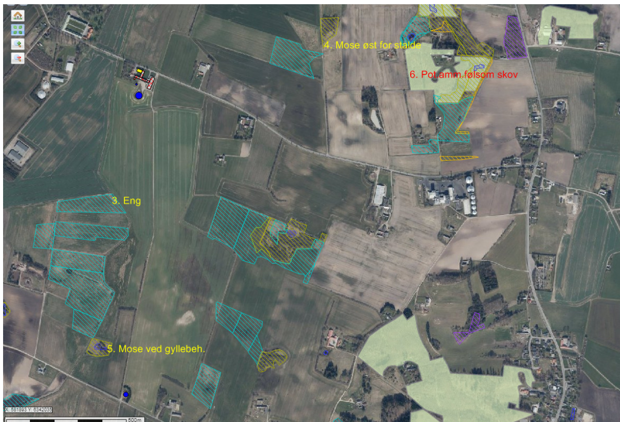
Figur6. Naturområder – kategori 3-natur.