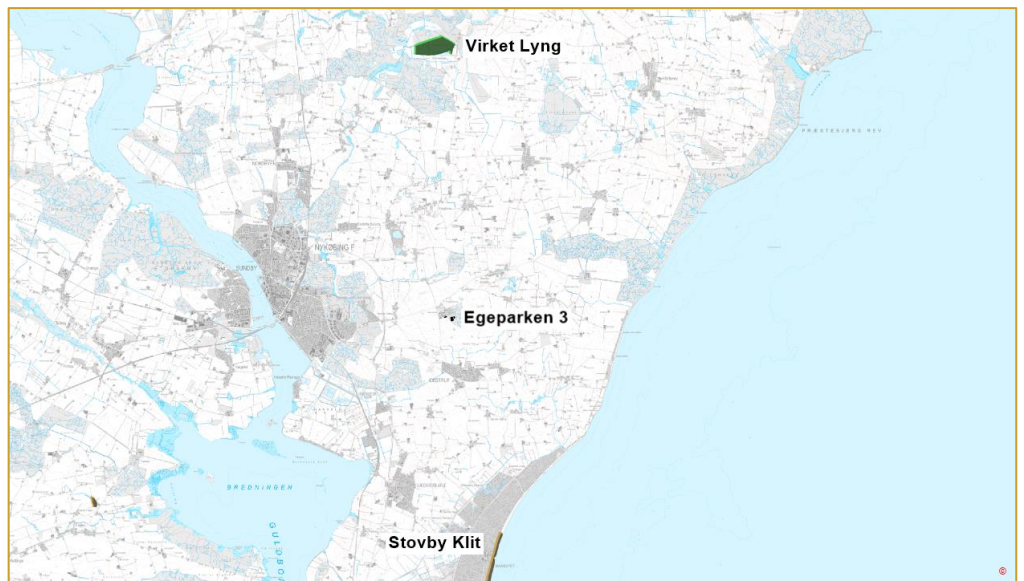
Kort 2. Beliggenheden af husdyrbruget i forhold til nærmeste kategori 2-natur (henholdsvis mørkegrøn og brun signatur).

De nærmeste kategori 2-naturområder er Virket Lyng, der ligger ca. 7 km nord for Egeparken 3 og overdrev Stovby Klit, der ligger ca. 5 km syd-øst for Egeparken 3, se kort 2. Den totale ammoniakdeposition fra den ansøgte produktion er i det elektroniske ansøgningssystem beregnet til 0,0 kg NH 3 -N/ha i begge naturområder. Dette er under det strengeste krav på 1,0 kg N pr. ha pr. år i totaldeposition på kategori 2-natur jf. § 27 husdyrgodkendelsesbekendtgørelsen. Dermed er depositionskravet overholdt.