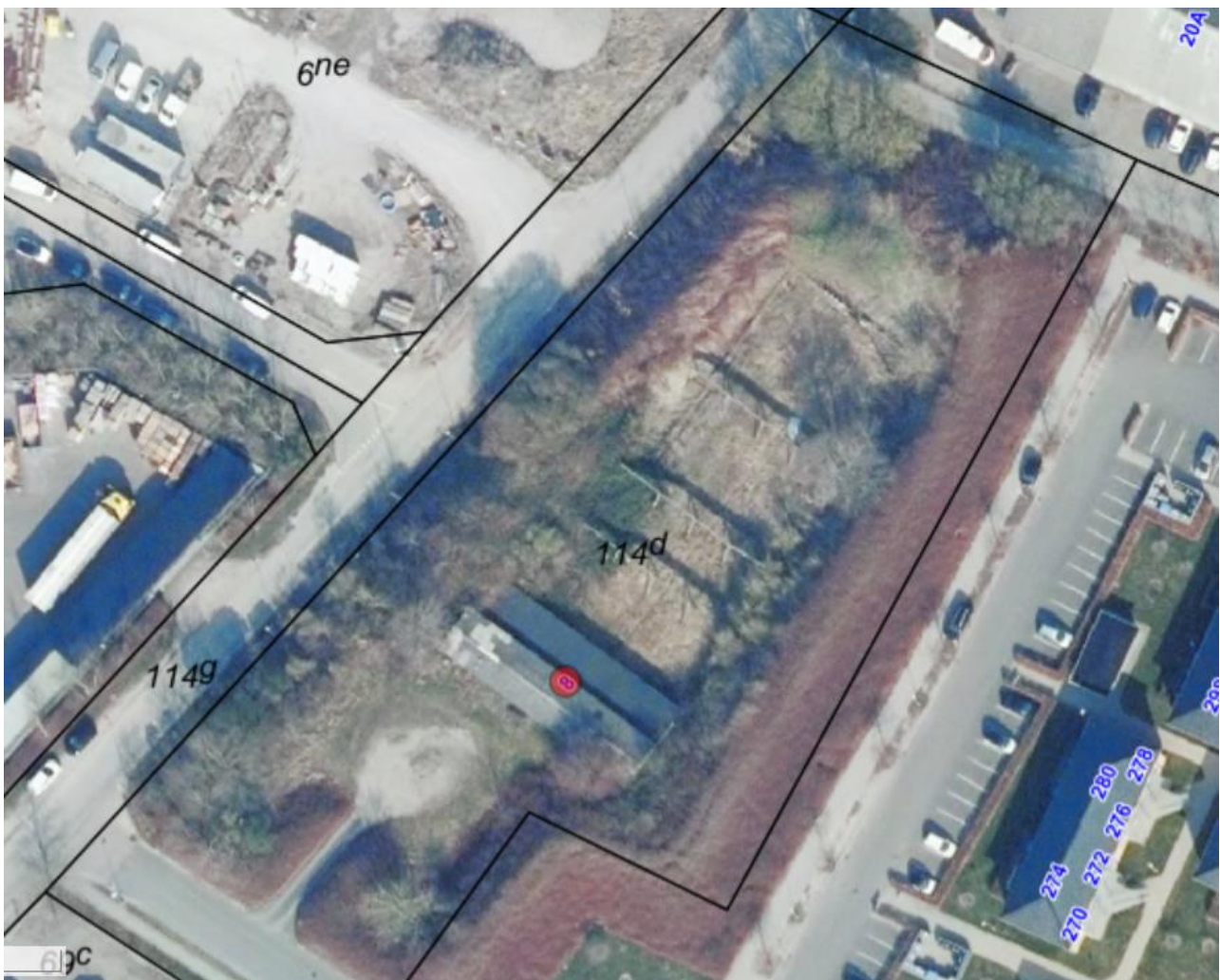
Luftfoto af skydebaneanlægget med matrikelskel, anno 2022

Skydebanen er beliggende i område 15.04.06.ER, som er udlagt til industri og tungere værksteds-, lager- og entreprenørvirksomhed m.v. Området grænser SØ op til boligområdet 15.04.05.BO. Den mest støjbelastede ejendom, der kan anvendes som bolig (Mosevej 17) ligger i banens skudretning ca. 100 meter nord for banens standpladser. Ejendommen er opført som bolig, men anvendes p.t. som kontor.