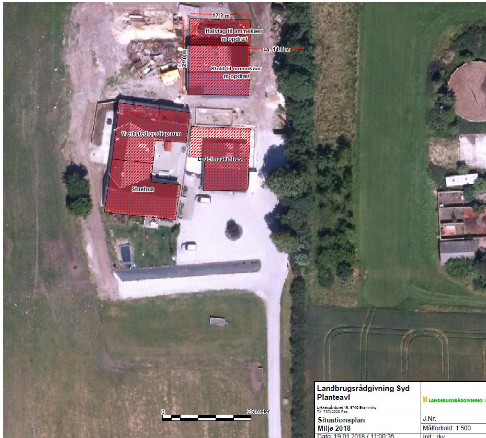
Kort 1. Situationsplan

Der er nærmere redegjort for de vurderinger, der ligger til grund for afgørelsen herunder.