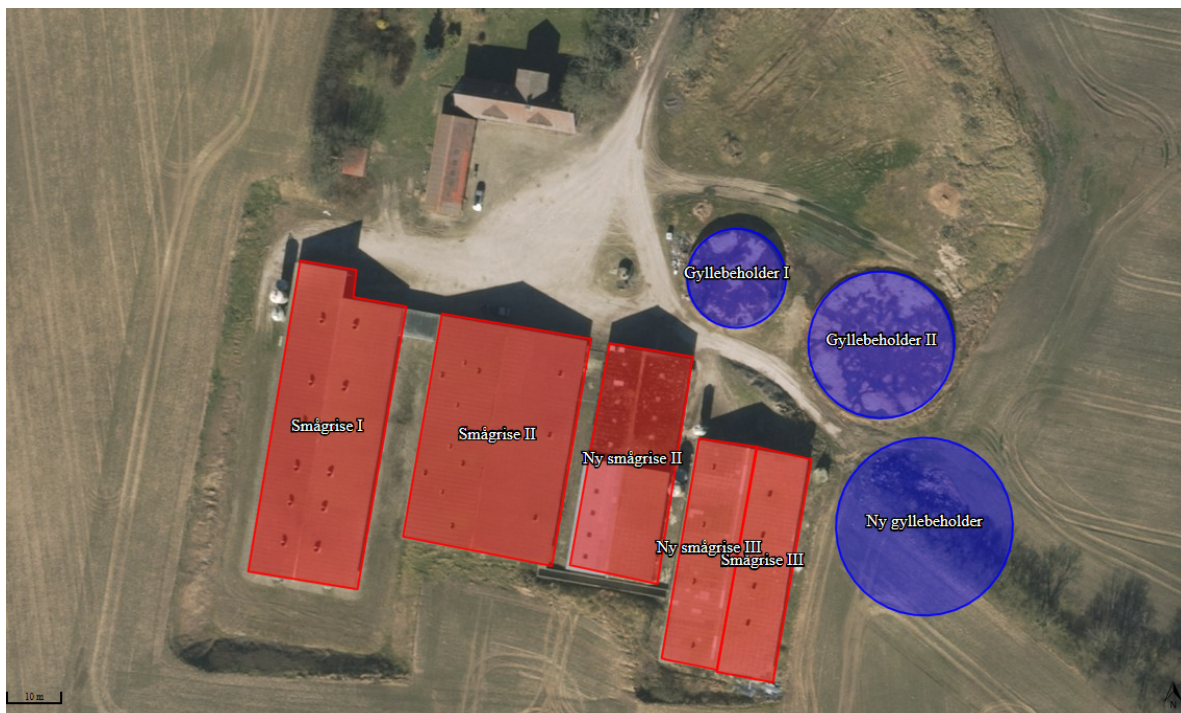
Figur 2.2. Oversigtskort over husdyrbrugets husdyranlæg og gødningsopbevaringsanlæg.

"Da der ikke findes oversigttegninger for ejendommen, er det valgt at indsætte et produktionsareal svarende til ca. 95 % af staldenes samlede størrelse. Det vurderes, at mellem 5-10 % af staldene er gangareal m.v., som ikke er omfattet af produktionsareal."