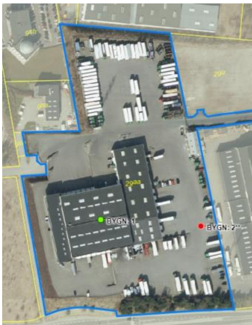
Luftfoto af ejendommen med matrikelskel

Virksomheden ligger på adressen Sintrupvej 63 i Brabrand, der matrikulært er en del af ejendommen Dalgårdsvej 7. Virksomheden ligger i den sydvestlige del af bygningen på ejendommen, og råder over ca. 1/3 af bygningens areal, der er på 6927 m 2 . Resten af bygningen anvendes af vognmandsfirmaet Ole Larsen A/S. I forhold til kommuneplanen ligger virksomheden i område 240107ER, der er udlagt til erhverv.