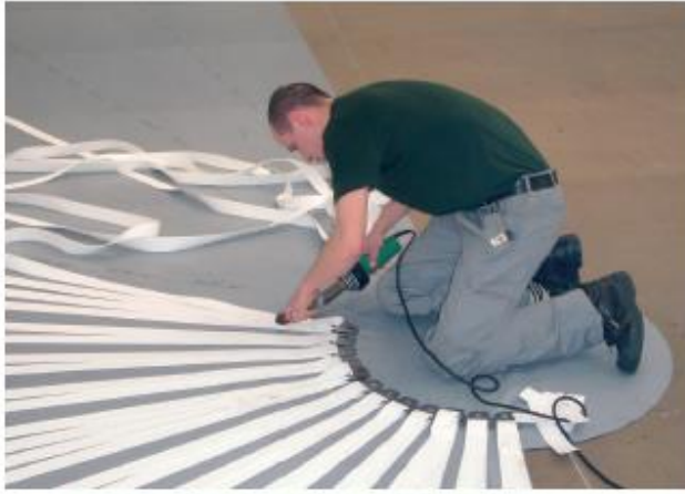
Produktion af Agro-Top overdækning