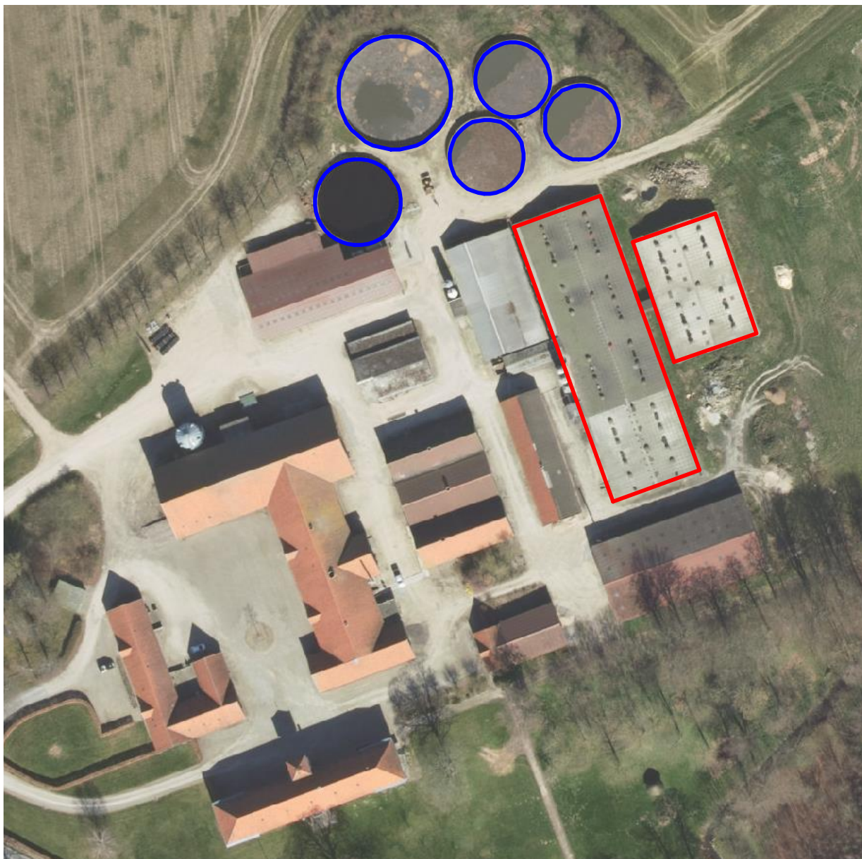
Figur: Svinestalde (markeret med rødt) og gylletanke (markeret med blå) på Anhof Alle 14A.