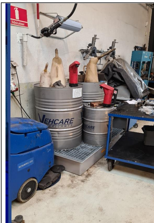
Opbevaring af råvare, 1. december 2020