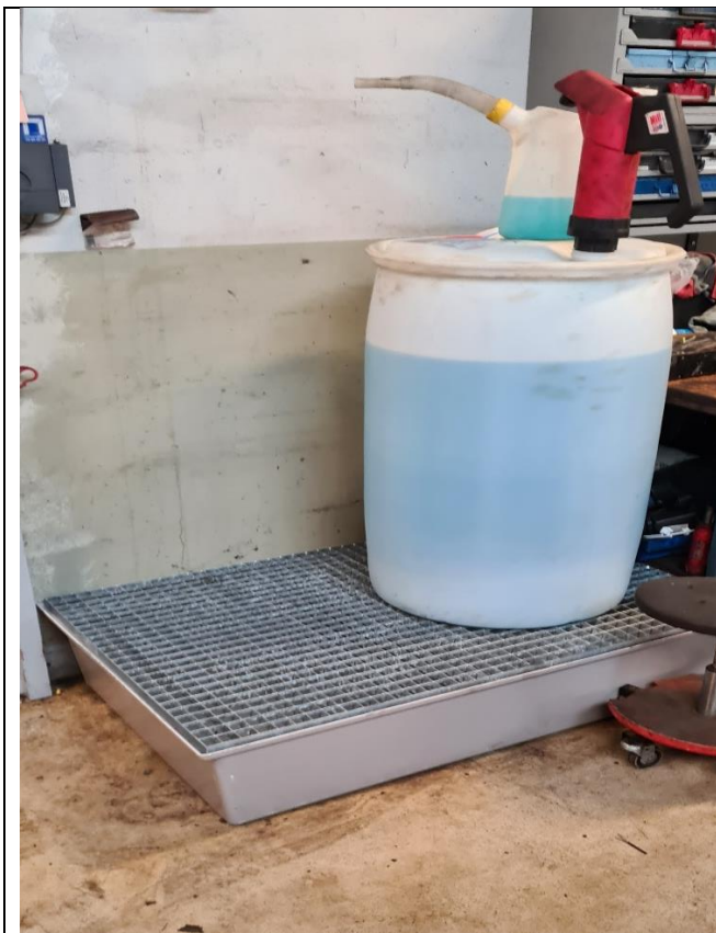
Opbevaring af flydende råvarer, indsendt den 1. december 2020