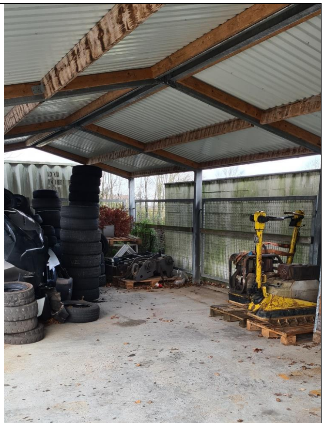
Opbevaring af dæk mm. Indsendt den 1. december 2020