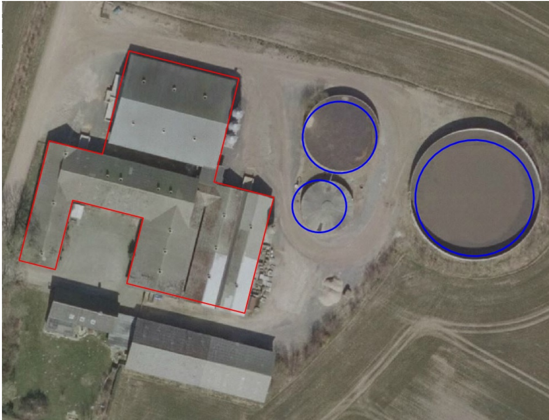
Luffoto 2015, der viser indtegningen af stalde og gylletanke i ansøgningen om miljøgodkendelse (2014).