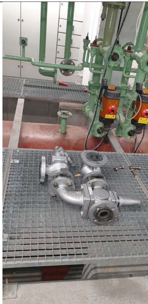
Billeder af sikkerhedsventilerne, som er demonteret på receiveren.