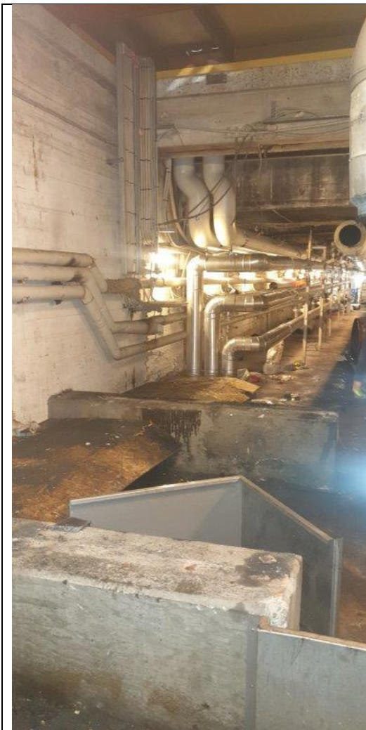
Billedet ovenfor viser at anlægget i INCO syder er demonteret