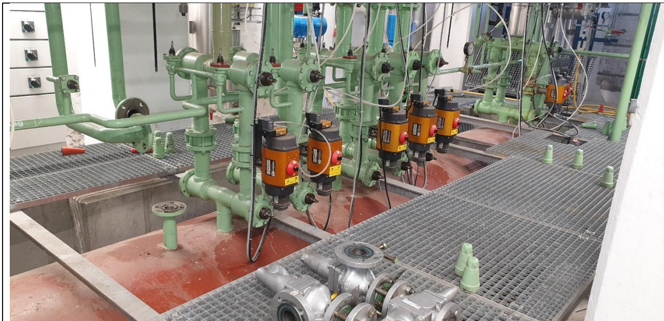
Billeder ovenfor af sikkerhedsventilerne, som er demonteret på receiveren .