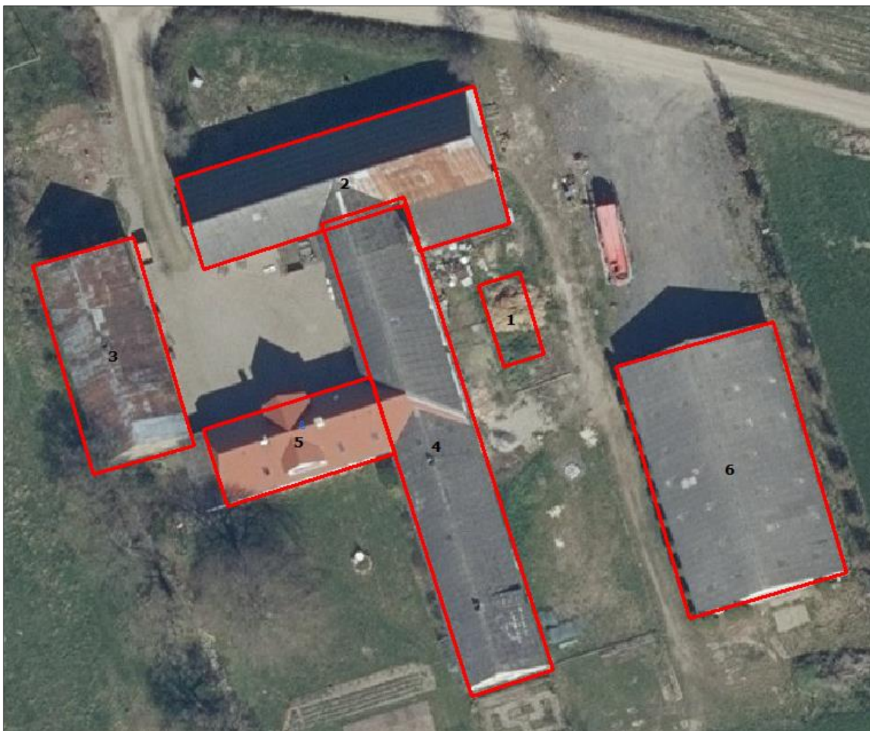
Figur 1. Husdyrbrugets driftsbygninger.