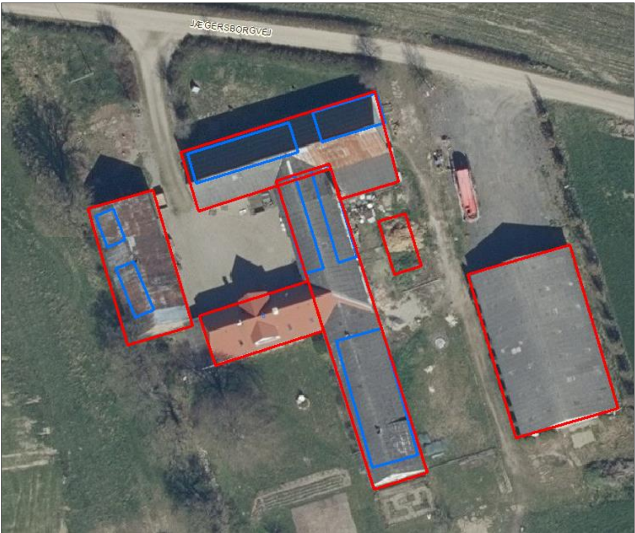
Bilag 2. Placering af produktionsarealer (blå) i staldene (røde).