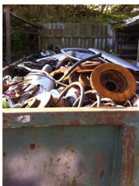
Container med jernskrot

Containeren skulle snart tømmes, og når det var gjort, ville ejer få udskiftet containeren med en ny, da den gamle ikke var så pæn. Der var dog ingen tegn på, at containeren var utæt.