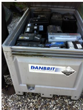
Opbevaring af batterier

Brugte batterier blev opbevaret i tæt beholder med låg.