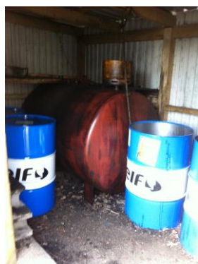
Opbevaring i udendørs skur med overdækning, fast belægning og opkant uden afløb til kloak

Oliefiltre, brugte spraydåser og spildolie blev opbevaret forsvarligt i skur med overdækning, fastbelægning og opkant uden afløb til kloak.