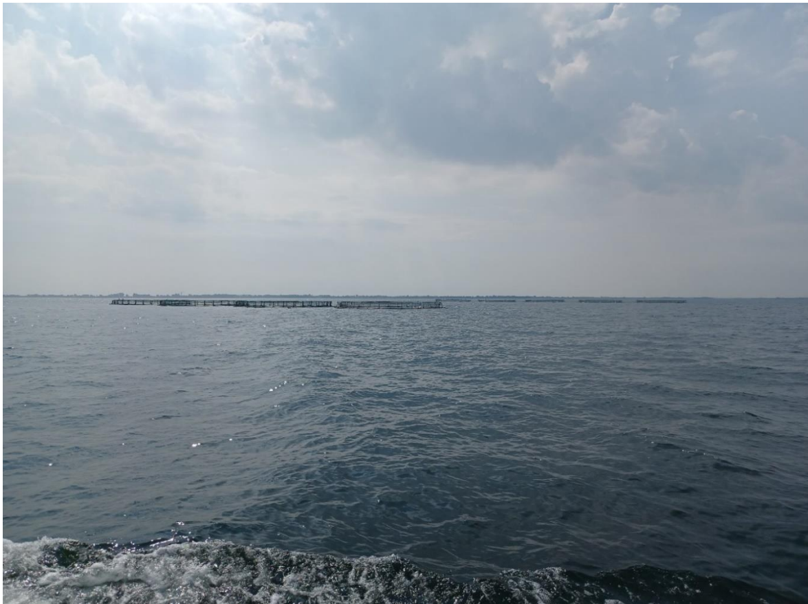
Figur 2: Skalø Havbrug.

Ved produktionens afslutning henter brøndbåd fisk fra 3-4 net, som slagtes sammen i en batch. I år vil fisk blive vejlet rund.