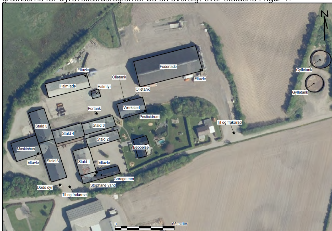
Figur 1. Oversigt over stalde, anmeldelsespligtige anlæg samt gødningsopbevaringsanlæg.

Det godkendte staldanlæg kan med denne miljøgodkendelse udnyttes fuldt ud inden for grænserne for dyrevelfærdsreglerne. Se en oversigt over stalde i figur 1.