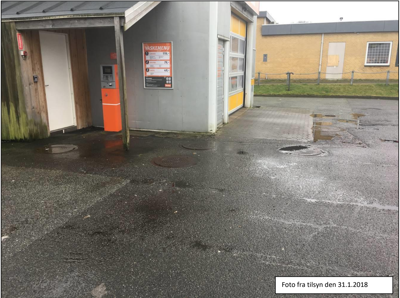
Foto fra tilsyn der viser belægningen foran vaskehallen, samt dæksler fra olieudskillere.