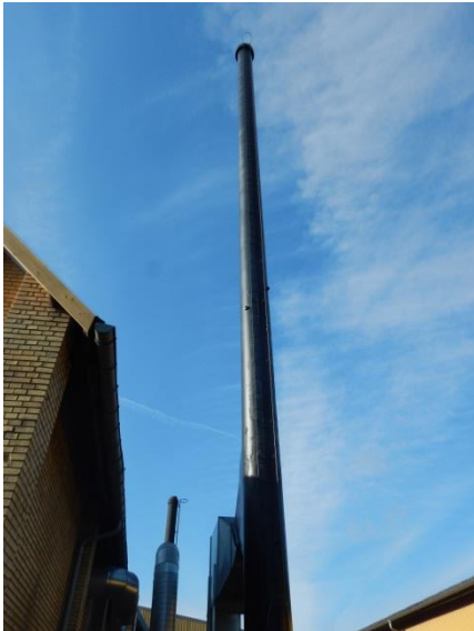
1. 30 m høj skorsten – afkast L1.