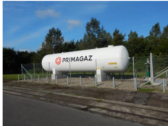
4. Ny gastank.