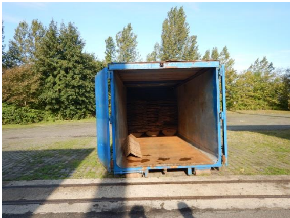
3. Container til papaffald.