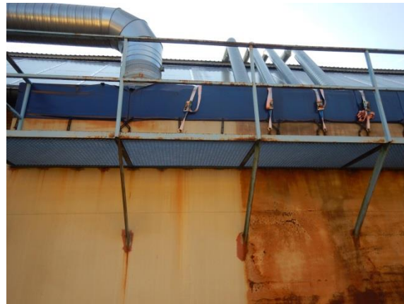
2. Luft fra udsugning føres igennem vandtank så små stykker polystyren bliver fanget.