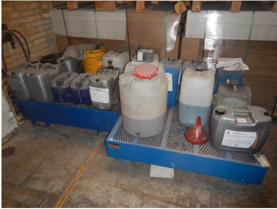
7. Oplag af kemikalier, olie og farligt affald.