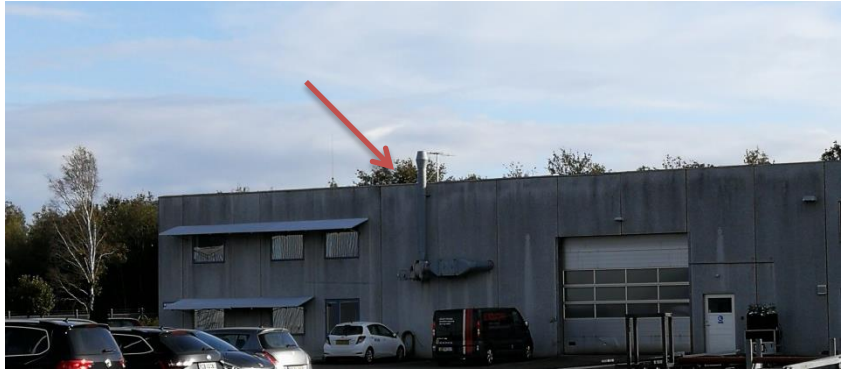
Billede: Afkast fra svejse – og slibe anlæg