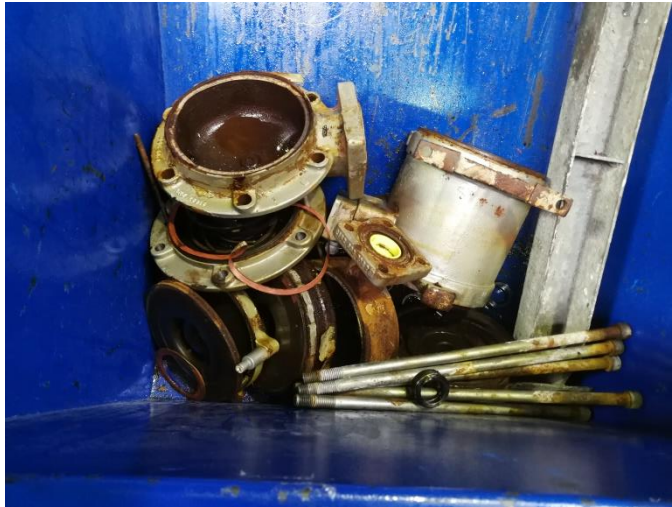
Billede 2019: metaldele med olierester og rester af olie i bunden af containeren.

fang olie fra servicering af køleanlæg hos kunder.