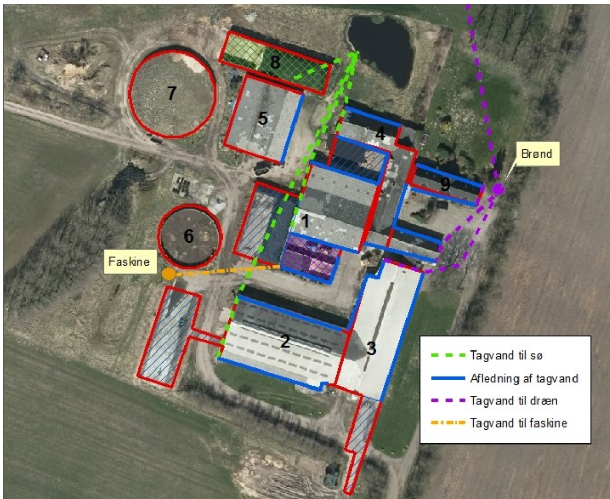
Figur 3. Afledning af tagvand fra eksisterende tage.

Det vurderes, at Husdyrgødningsbekendtgørelsens generelle krav til håndtering af spildevand er tilstrækkelige til at beskytte omgivelserne mod forurening fra spildevand.