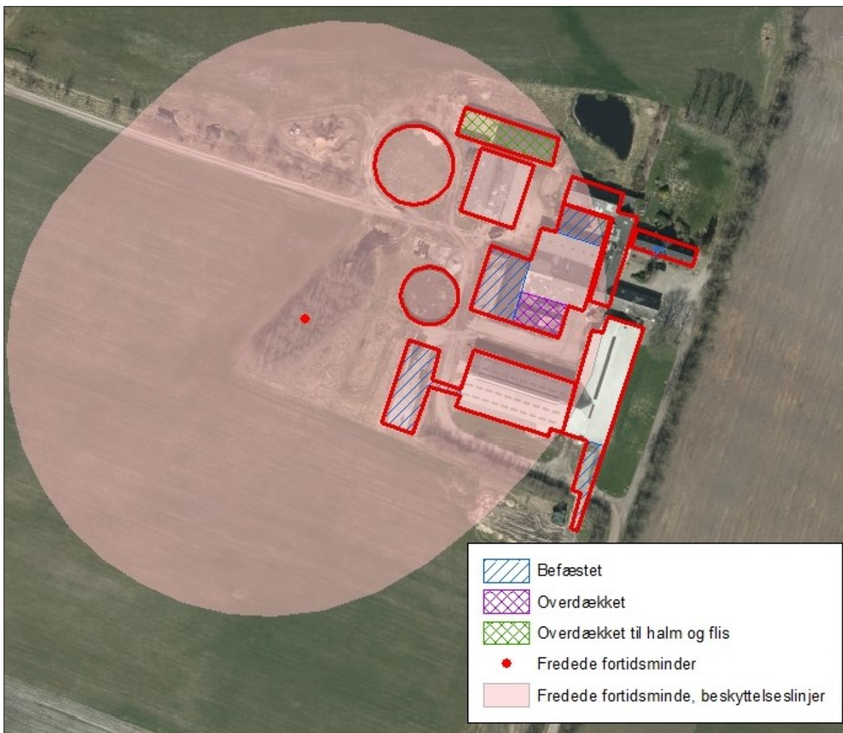
Figur 5. Anlæggets placering i landskabet.

Overdækning af ensilagepladserne, samt opbygning af mur ved de befæstede arealer ligger inden for fortidsmindebeskyttelseslinjen.