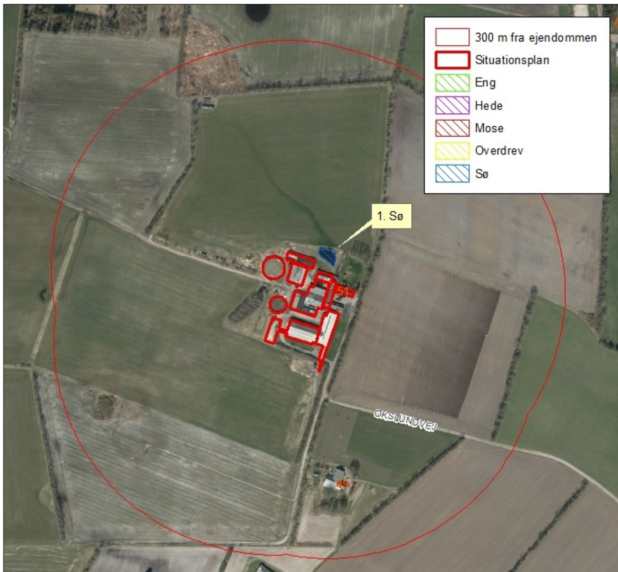
Figur 4. Kort over kategori 3 natur ved anlægget.

Naturtyperne er vist i nedenstående figur og tabel.