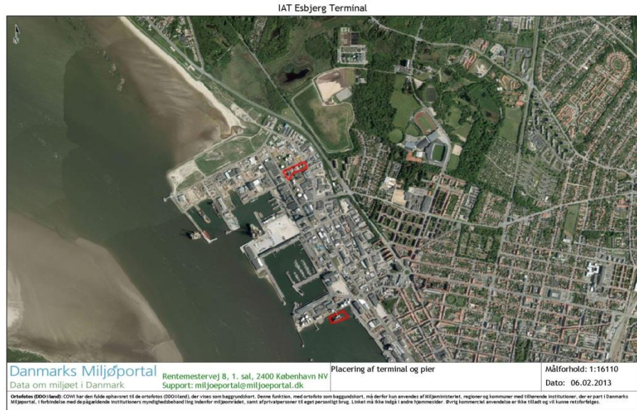
Figur 2 Overbliksbillede af placeringen af tanklageret og havnepier.

I Figur 3 er angivet placeringen af de 4 tanke. To af tankene er udstyret med betontankgårde, mens de to andre tanke har en fælles tankgård, bestående af en jordvold.