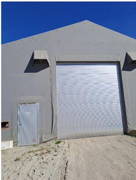
Hallen på Areal 12