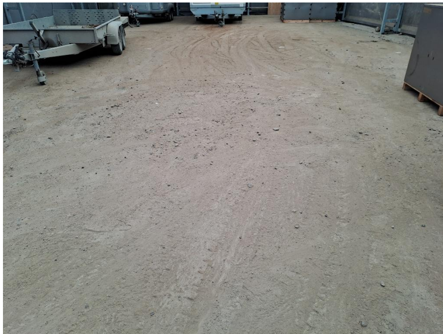
Belægning i hallen på areal 12