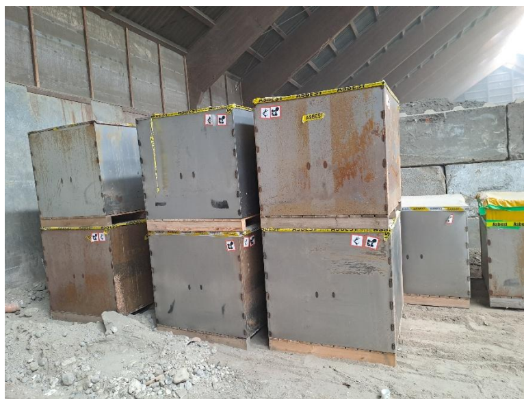
Fyldte stålkasser i Hal 10, som flyttes til den lille hal på Areal 12