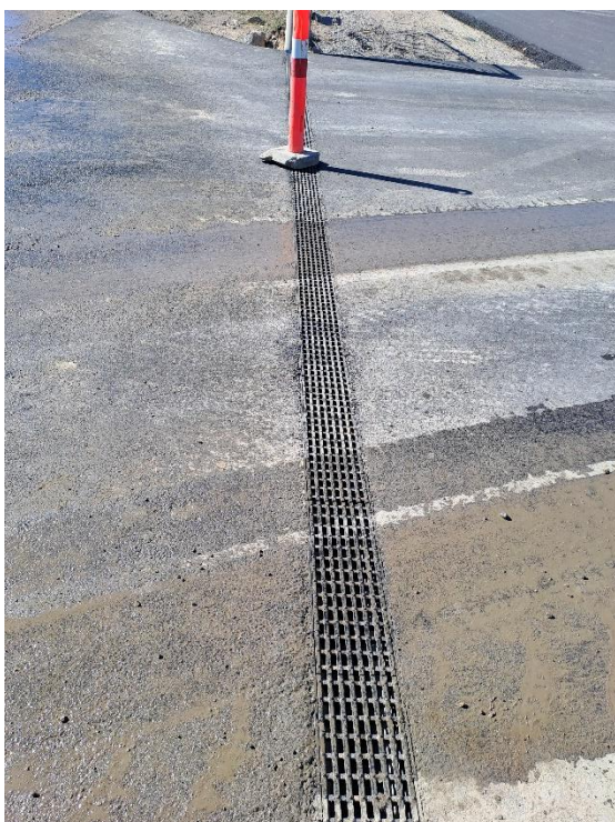
Rist ved port ved ny asfaltbelægning. Risten leder til CMPs regnvandskloak