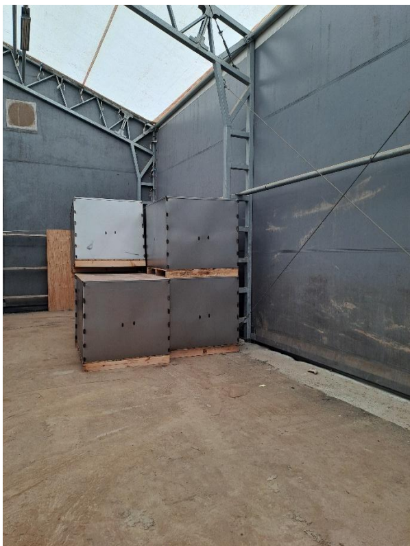
Tomme stålkasser i hallen på Areal 12. Fyldte stålkasser vil max stå i 2 kasser ovenpå hinanden.