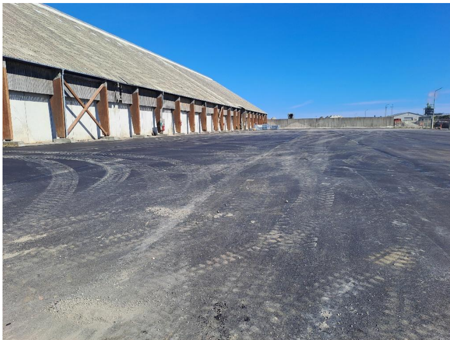
Ny asfaltbelægning på Areal 11