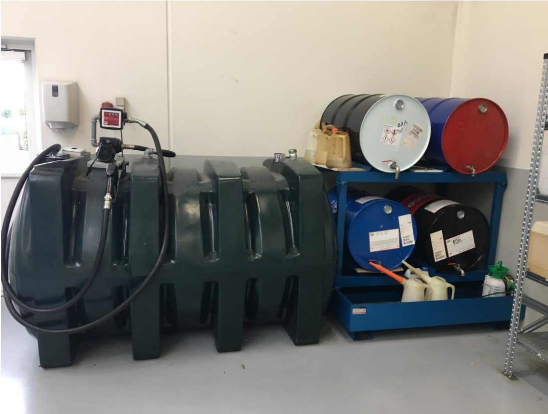
Dieseltank og opbevaring af råvarer.