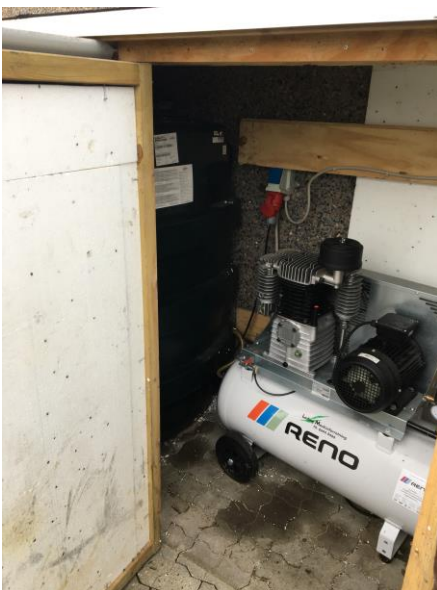
Olietank og kompressor i skur

Virksomhedens væsentligste støjkloder er kørsel til og fra virksomheden. Kompressor er placeret i skur ved maskinhallen. Virksomheden ligger i god afstand til støjfølsomme områder, og der foreligger ingen klager over støj.