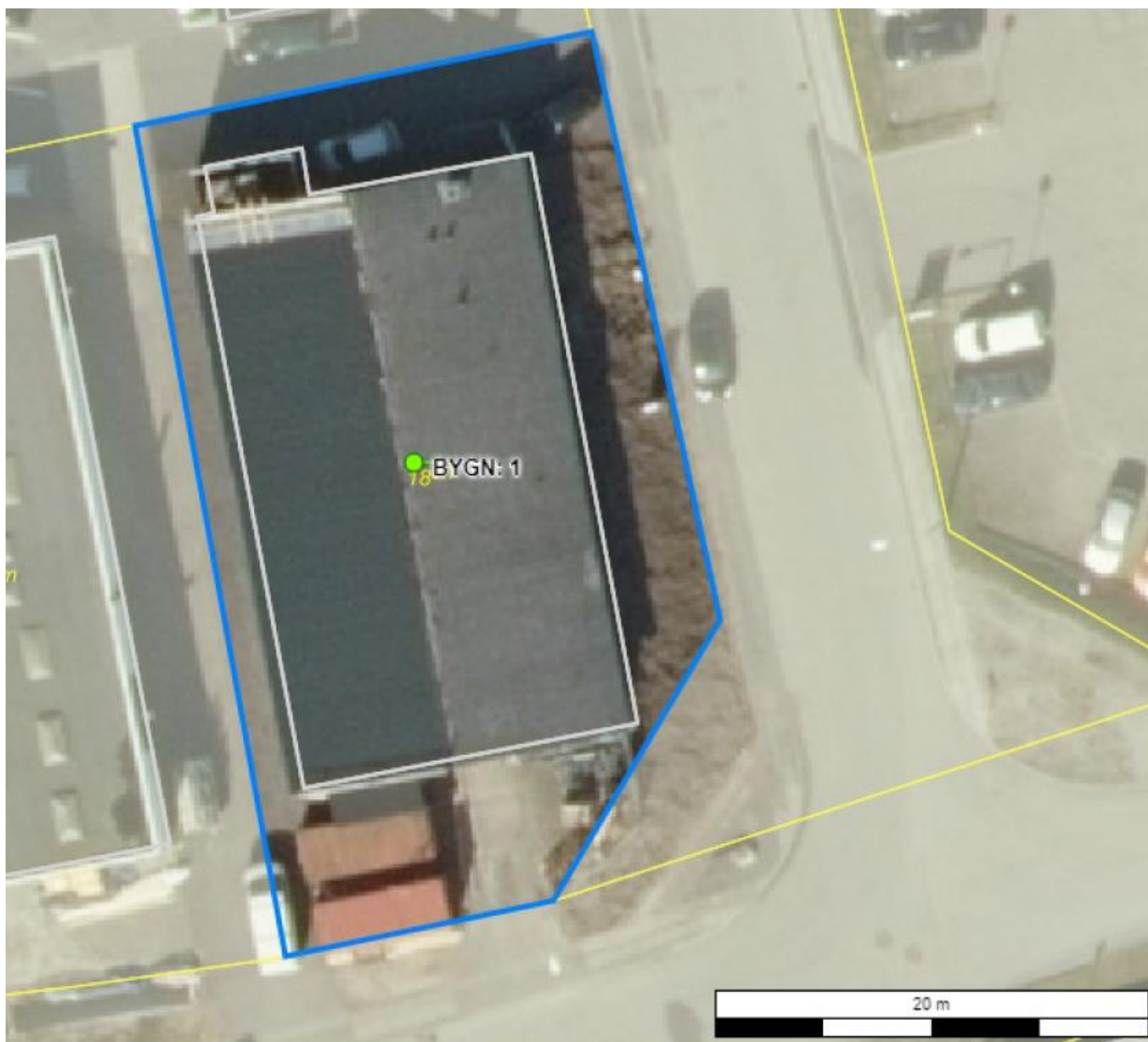
Luftfoto med virksomhedens beliggenhed og matrikelskel

I forhold til kommuneplanen ligger virksomheden i område 160501ER, der er udlagt til erhverv, og som er omfattet af lokalplan 116 - se nenstående luftfoto.