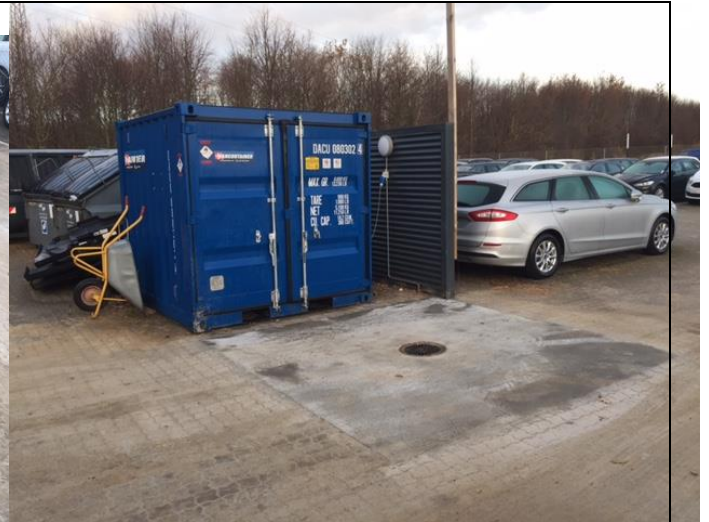
Billede 3. Opbevaring af benzin