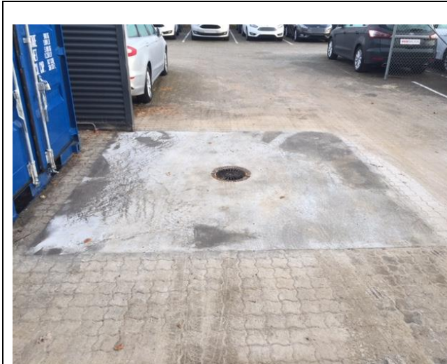
Billede 2. Tankplads