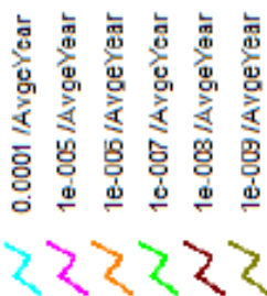
Figur 4 Iso-risikokurver for stedbunden risiko.