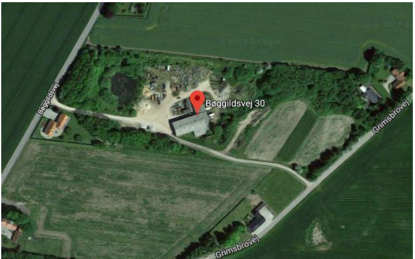
Luftfoto af ejendommen. Nedknusningsoplag skal være på den østlige del af grusgraven.