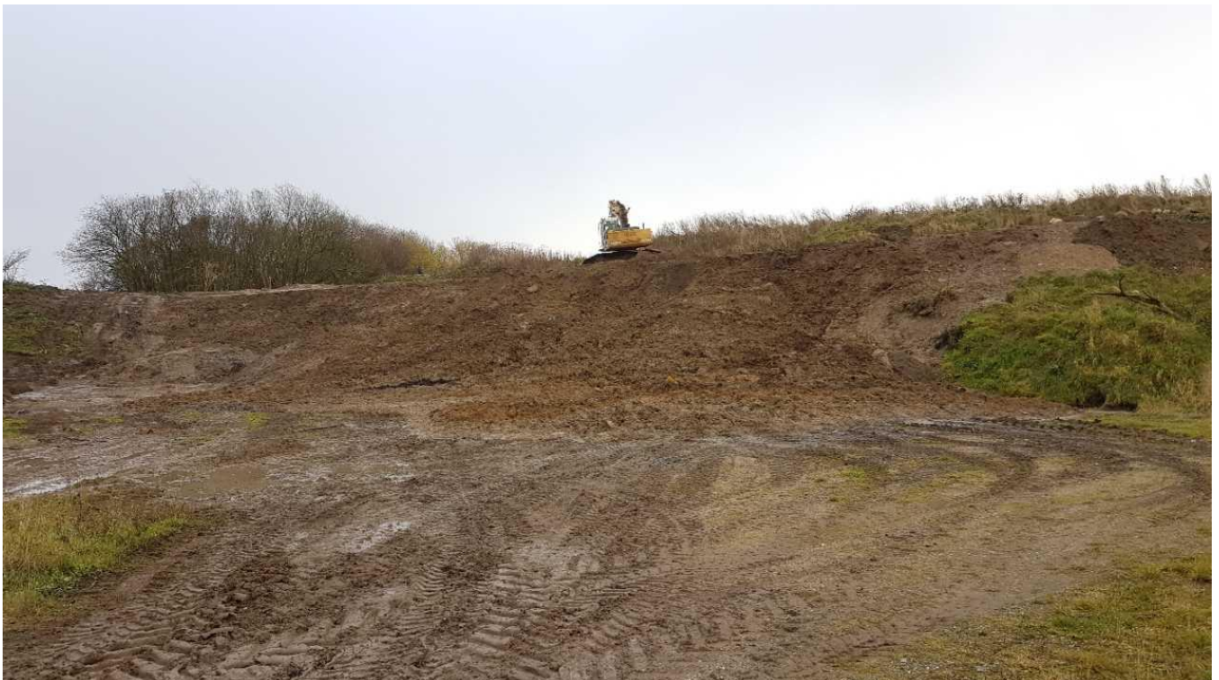
Billede af renjordstippen på samme ejendom.