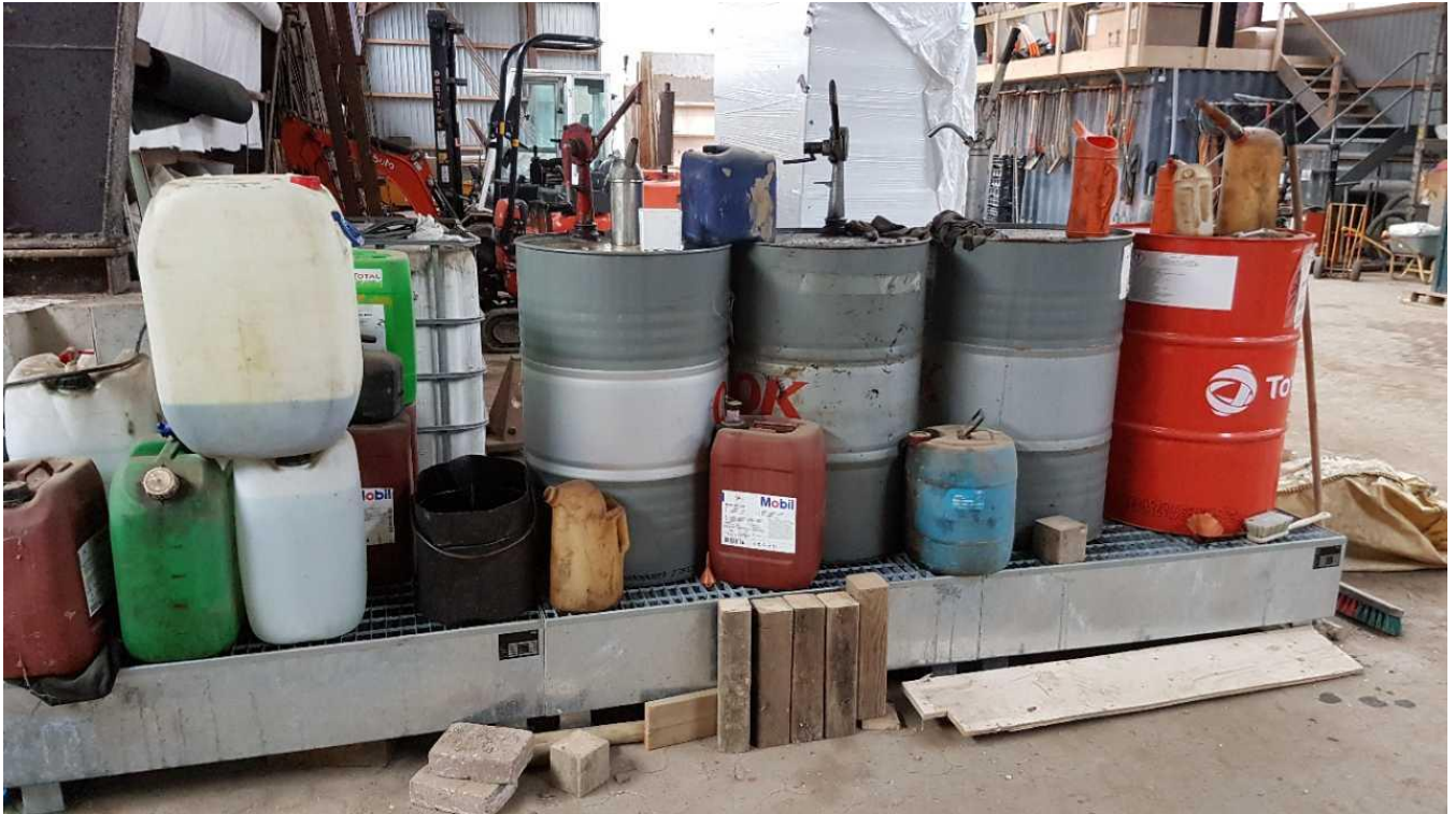
Indendørs opbevaring af olier og kemikalier med spildsikring.