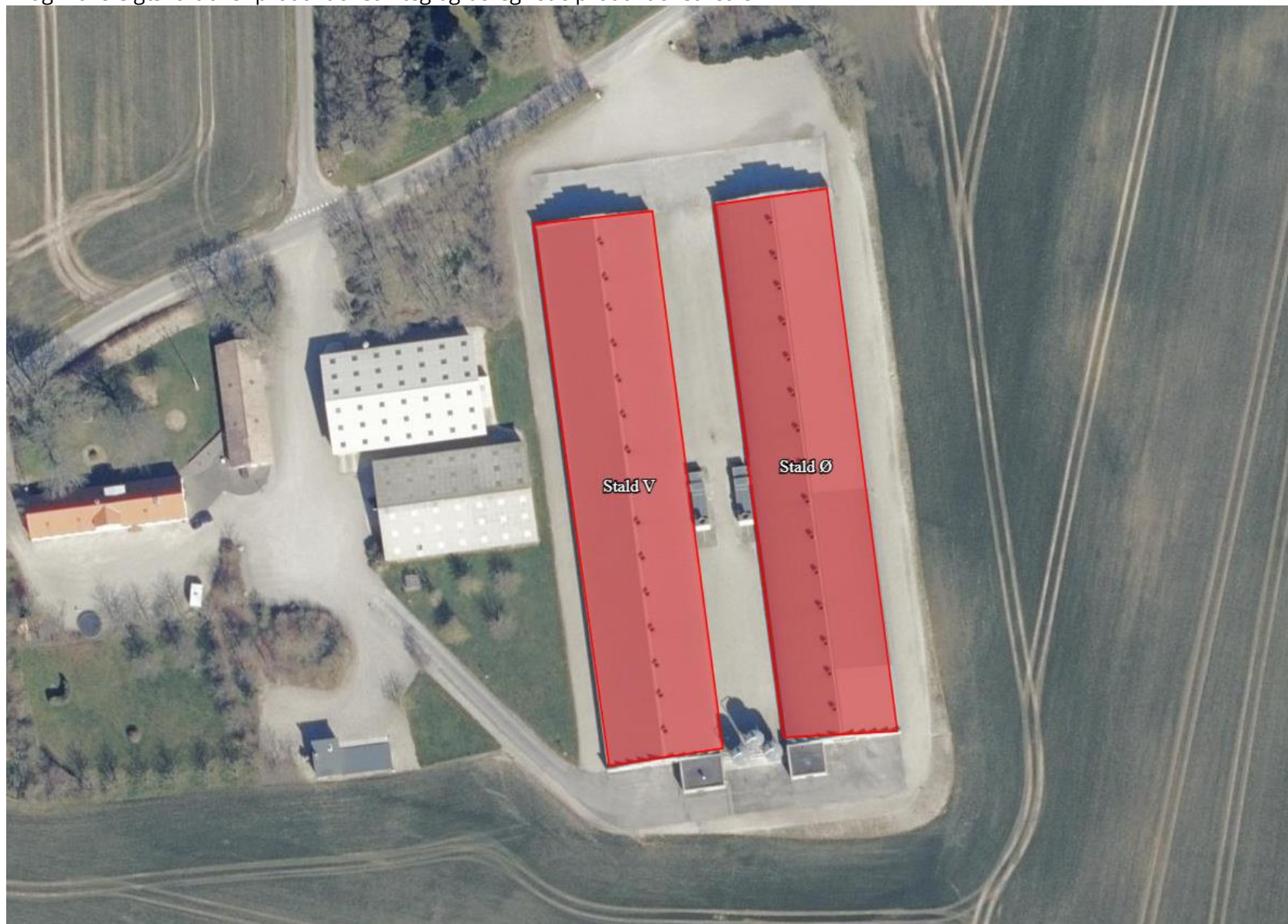
Bilag 2 oversigtskort over produktionsanlæg og beregnede produktionsarealer