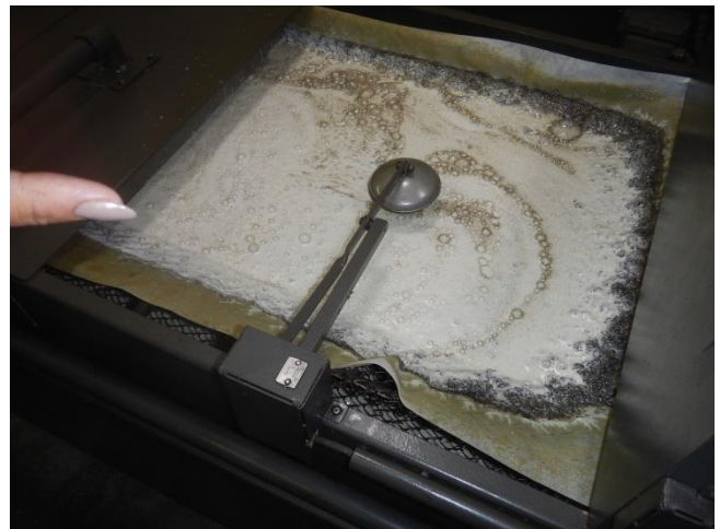
10. Filterdug til renholdelse af bore- skærevæske, der genbruges i CNC styret bearbejdningsmaskine