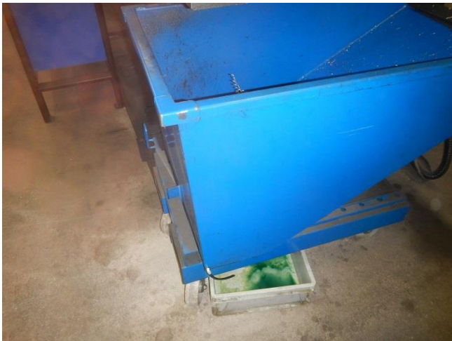
7. Produktionshal. Lille container til bore- drejespårner. Afdryp sker til opsamlingsbakke