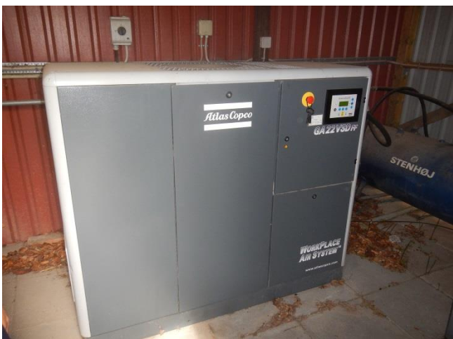
11. Indendørs placeret trykluft-kompressor anlæg