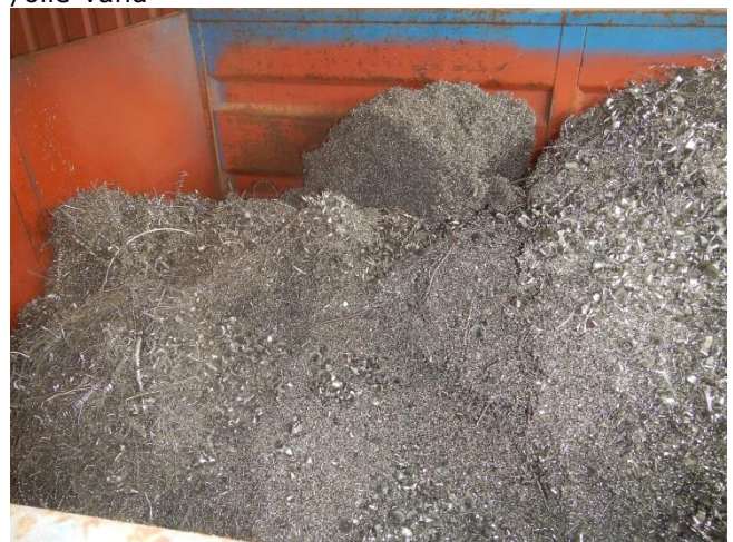
4. I oplagsplads under tag. Container med spåner.