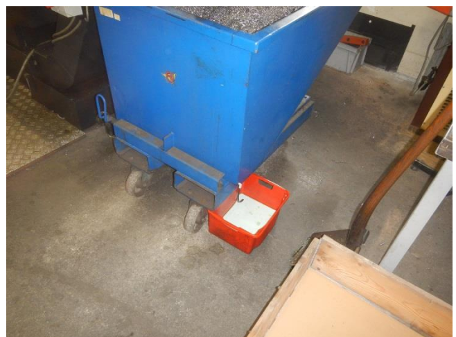
6. Produktionshal. Mindre container til drejespåner. Afdryp sker til opsamlingsbakke.