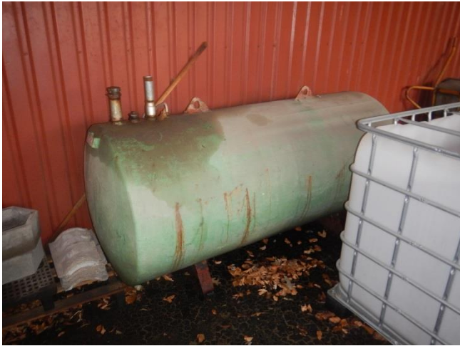
1 . Tankgård med opkant under tag. Fyringsolietank fra 1979- skal sløjfes senest 2019