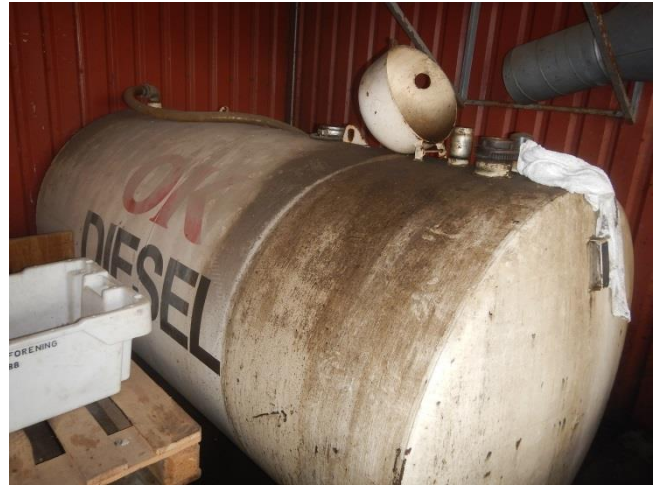
2. Tankgård med opkant, under tag. Spildolietank /olie-vand