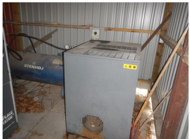
12. Indendørs placeret trykluft-kompressor anlæg