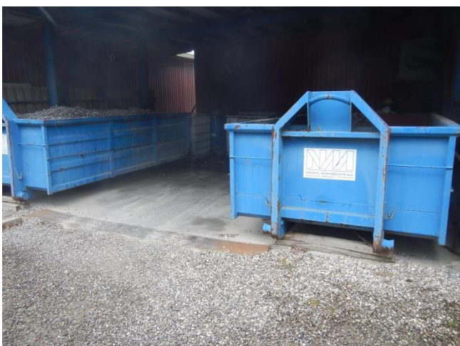
5. Indkørsel til overdækket oplagsplads til affald