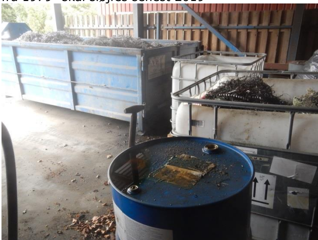
3. Oplagsplads under tag. Oliespild evt. dryp fra spåner løber til opsamlingsbrønd Foran. 200 l tromle til spildolie. Bagved: container med spåner