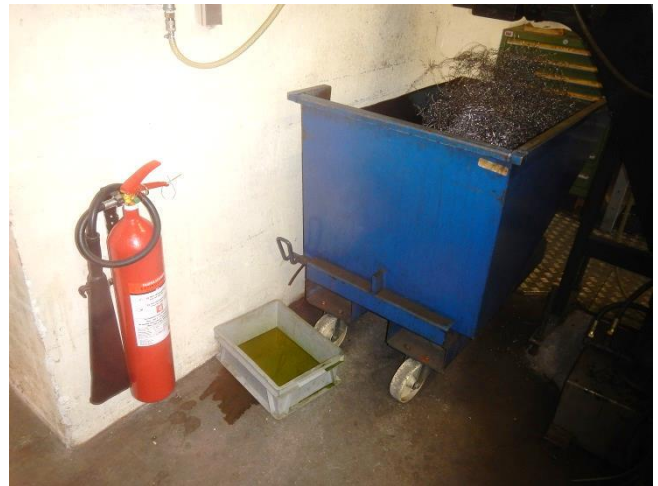
8. Produktionshal. Lille container til bore- drejespårner. Afdryp sker til opsamlingsbakke.