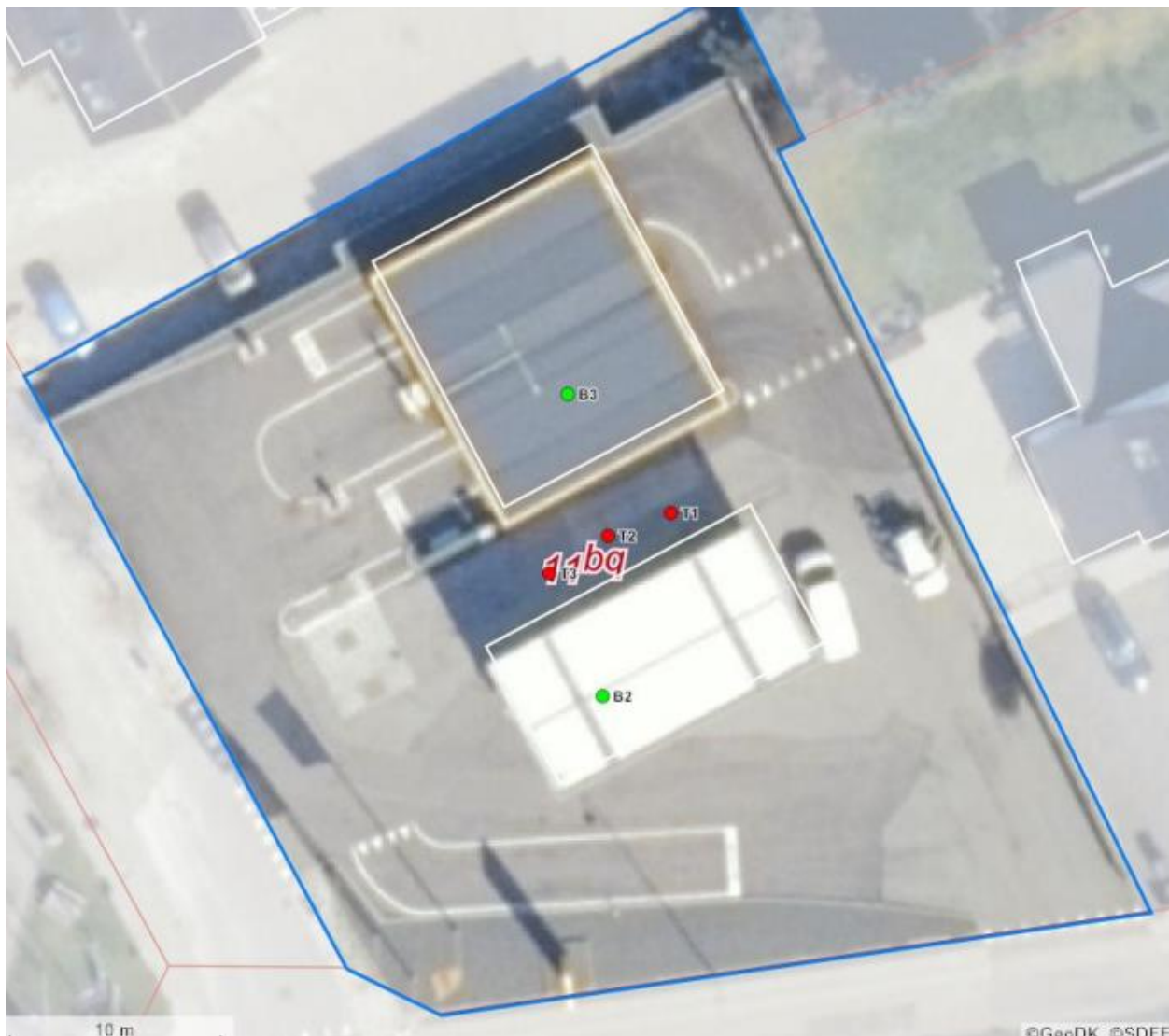
Luftfoto af virksomheden med matrikelskel fra BBR

I forhold til kommuneplanen ligger virksomheden i erhvervsområde 160104BO, der er et blandet bolig- og erhvervsområde. Virksomhedens vaskehal ligger mindre end 100 meter fra bolig.