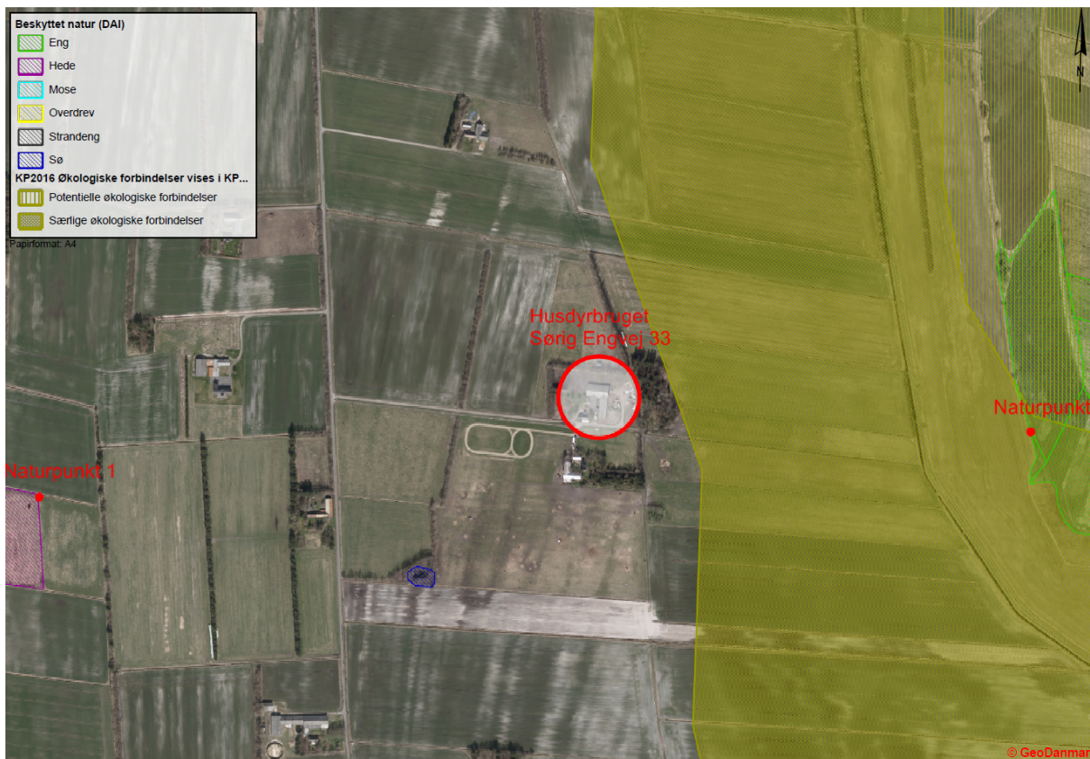
Figur 2 - Husdyrbrugets beliggenhed i forhold til naturpunkt 1-2 (rød prik).