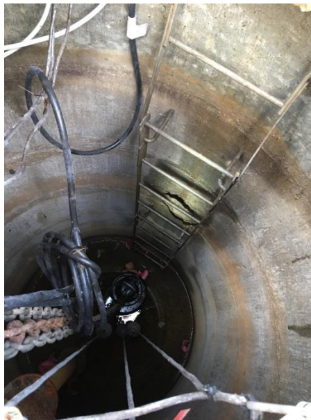
Drænet er næsten tørlagt, der er ikke meget afledning af vand.

Pumpebrønden er forsvarligt tillukket dog uden lås, men der kræves brøndhægter. Pumpen blev ikke testet, men det fortælles at den virker efter hensigten.