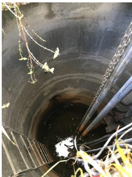
Væggen er våd af vand fra drænet.