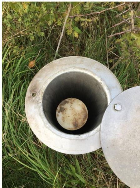
Nyetableret kontrolboring, DGU 200.6594

Nyetableret kontrolboring ved det nye vådområde. Denne boring var aflåst og havde prop på selve boringen. Der mangler dog både DGU-nummer og pejle mærkning. Albertslund Kommune bedes snarest muligt få fuldt op på dette, som følge af gældende regler i Bekendtgørelse om udførelse og sløjfning af borer og brønde på land. BEK nr. 1260 af 28/10/2013.