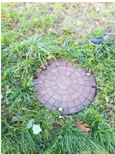
Kontrolboring Egelundsparken, DGU 200.4221