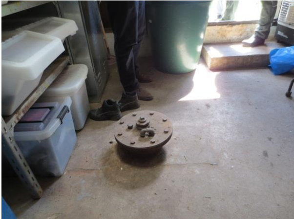
Kontrolboring, snubbekorsvej 23, DGU 200.1458

Pumpebrønd vest ligger placeret under luftledninger og i kanten af golfbanen. Her var dækslet ikke aflåst men kan åbnes med hægter. Det var tydeligt at se, at der løb vand til brønden fra drænet under volden. Målerskabet var aflåst.