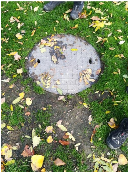
Brønd øst ved fodboldbane