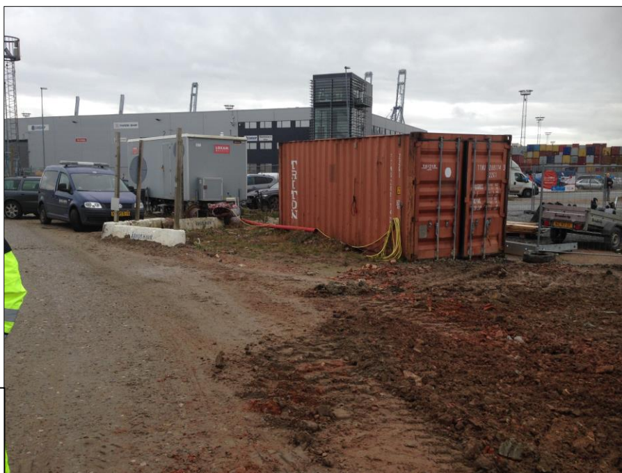
Foto af opbevaringscontainer ved indkørselspladsen på Miljøhavnen.

Containeren indeholder olie-smøremidler til maskiner samt brændstof/olietank.