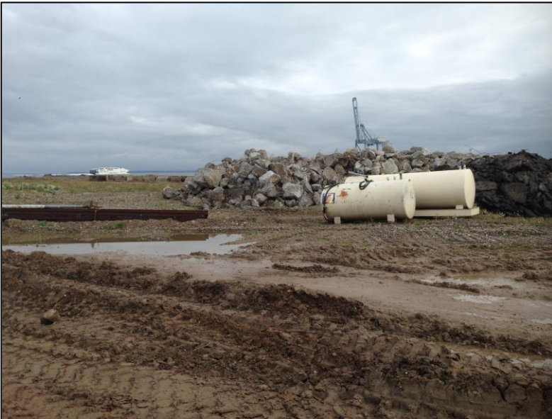
Foto fra opfyldningsområdet på jordtippen på Oliehavnen, hvor de to olietanke står.

https://www.retsinformation.dk/forms/R0710.aspx?id=175799 .