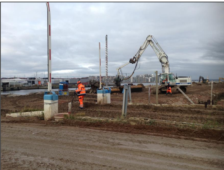
Foto fra opfyldningsområdet på jordtippen på Oliehavnen. Området er ved af blive udjævnet. Jordtippen genåbner når Miljøhavnens jordtip er opfyldt.

Foto fra opfyldningsområdet på jordtippen på Oliehavnen, hvor de to olietanke står.