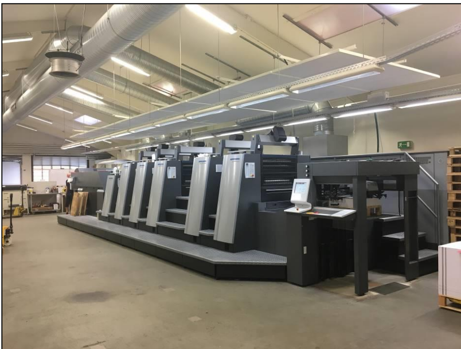
Den store nye trykkemaskine midt i hallen