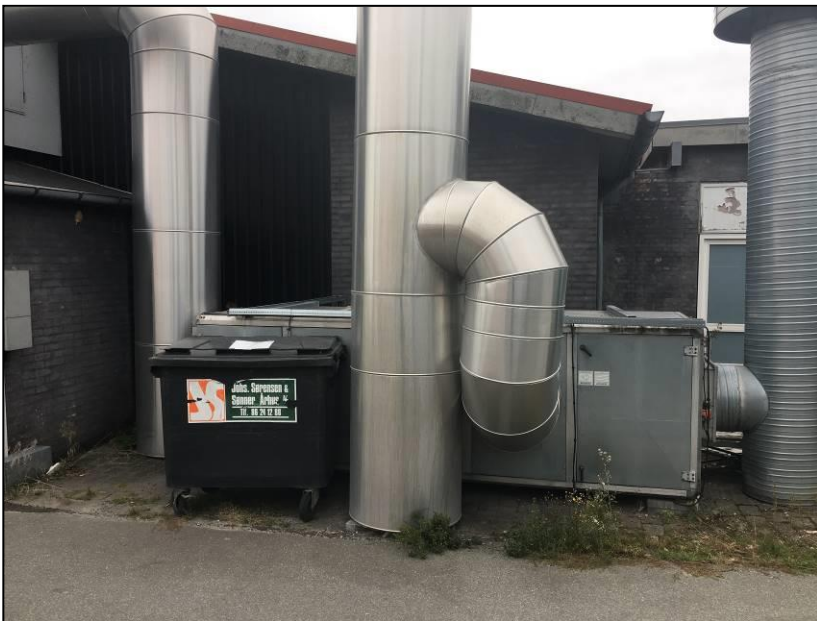
Foto af rumsug og varmegenindvindingsanlæg

Det årlige forbrug angivet til at være steget fra ca. 850 liter til ca. 1000 liter. Ved et forbrug på ca. 1.000 liter IPA/årligt er S stadig < 250 og afkashøjden er dermed ok.