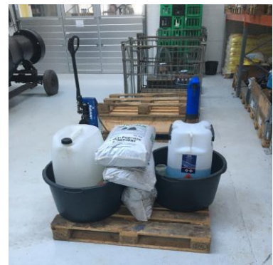
Opbevaring af flydende hjælpepestoffer

Virksomheden overholder luftvilkårene i miljøgodkendelsen. Norddjurs Kommune har ikke modtaget støjklager relateret til virksomheden.