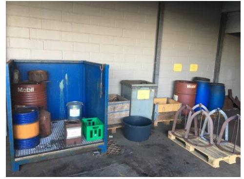
Sortering og opbevaring af affald