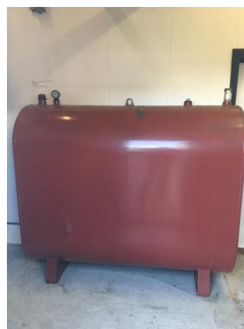
Olietank fra 2018

Matriklen er kortlagt på vidensniveau 1 (V1) i JAR (jordforureningslovens arealregister). V1 betyder, der er kendskab til aktiviteter, der kan have forårsaget jordforurening.