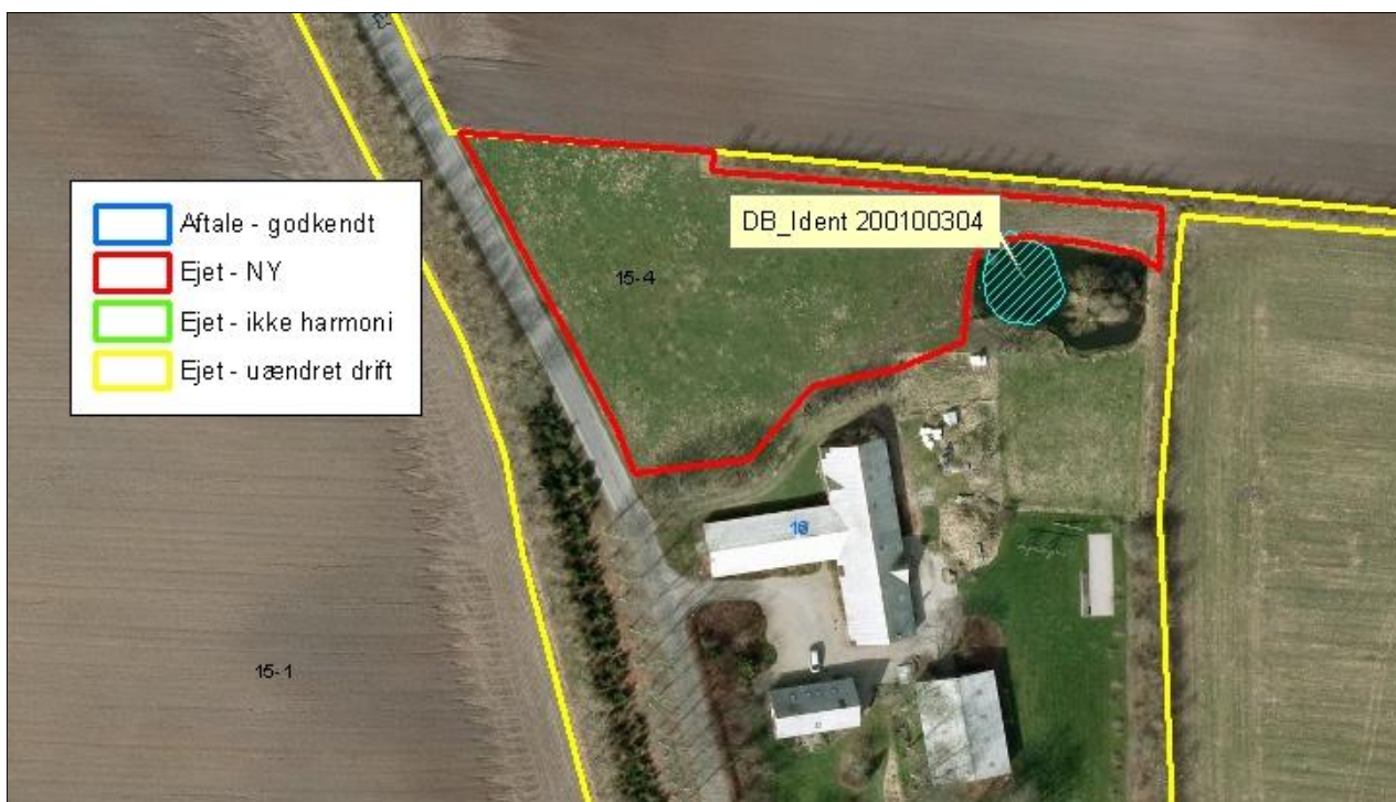
Figur 3. Naturarealer beskyttet efter Naturbeskyttelseslovens §3 i umiddelbar nærhed af ejendommens nye udbringningsarealer.