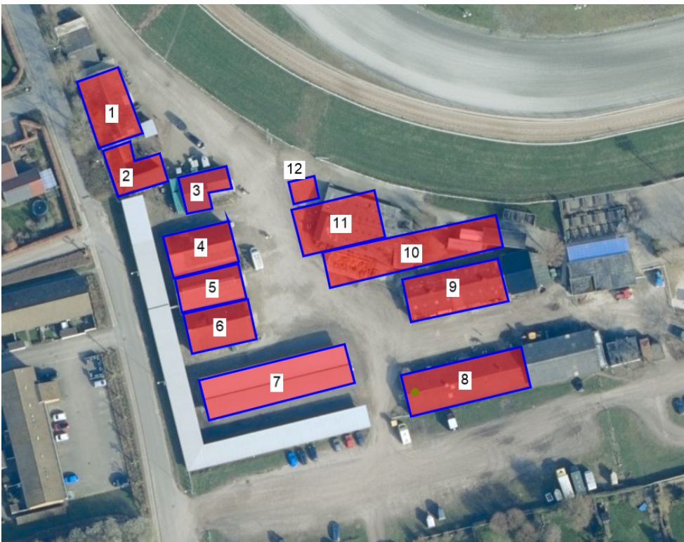
Fig. nr. 3. Placeringen af de stalde (1-11), hvor der ansøges om permanent opstaldning af heste, samt placeringen af en ny møddingsplads (12).

Ovenstående fig. nr. 1 og fig. nr. 2 viser beliggenheden af eksisterende og ansøgte stalde på Galopbanevej 31. Nedenstående oversigtskort i fig. nr. 3 viser placeringen af de stalde, hvor der ansøges om permanent opstaldning af heste. Nedenstående tabel nr. 1 viser størrelse af stald, størrelse af produktionsareal og antal hestebokse, fordelt på stalde med permanent opstaldning.