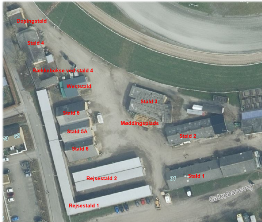
Fig. nr. 1. Beliggenheden af eksisterende stalde på Fyns Væddeløbsbane.

Nedenstående oversigtskort viser beliggenheden af eksisterende stalde m.v. på Fyns Væddeløbsbane.