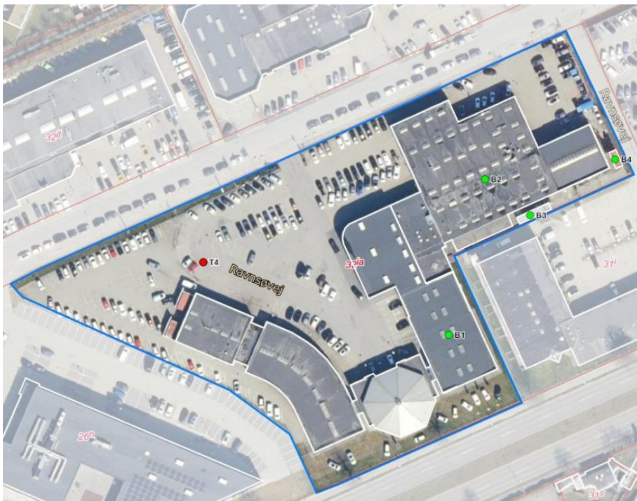
Luftfoto af virksomheden med matrikelskel fra BBR

I forhold til kommuneplanen ligger virksomheden i erhvervsområde 150803ER, Vejlbj-Risskov (distrikt), hvor Byplanvedtægt nr. 3 er gældende.