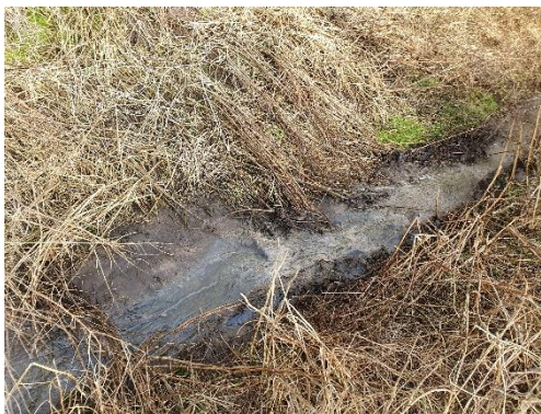
Lammehaler i grøft/vandløb inden vand løber ud over mark