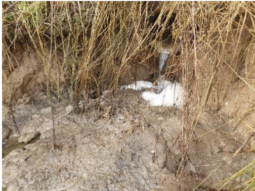
Rørudløb hvor åbent vandløb starter